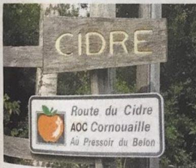
Bretainiako Cornouaille ibilbidean dagoen seinale bat. ROUTE DU CIDRE CORNOUAILLE