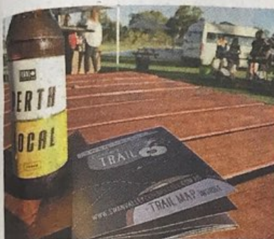
Australiako Swan Valley Cider Trail ibilbideko irudi bat. SWAN VALLEY CIDER TRAIL