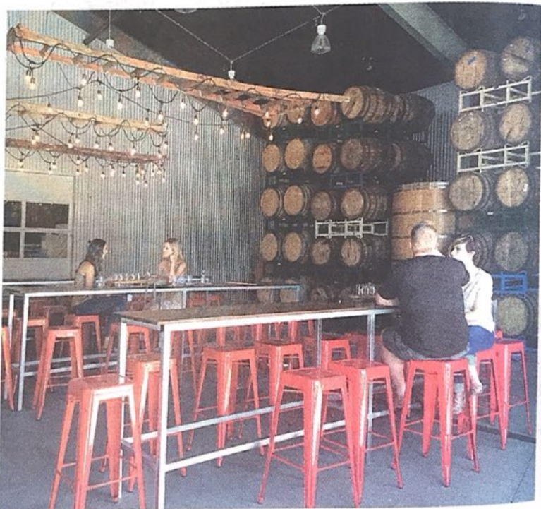
AEBetako San Luis Obispo Cider Tour bidean dagoen ostatu bat. SAN LUIS OBISPO CIDER TOUR