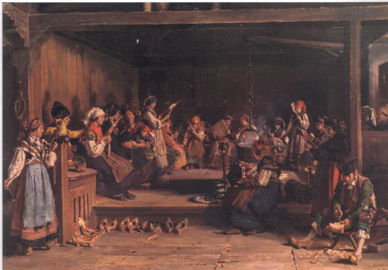
Enriba, El Filandón , de Luis Álvarez Catalá. Abaxo, cartelu publicitariu, d'entamos dei sieglu XX, d'El Sol de Asturias.