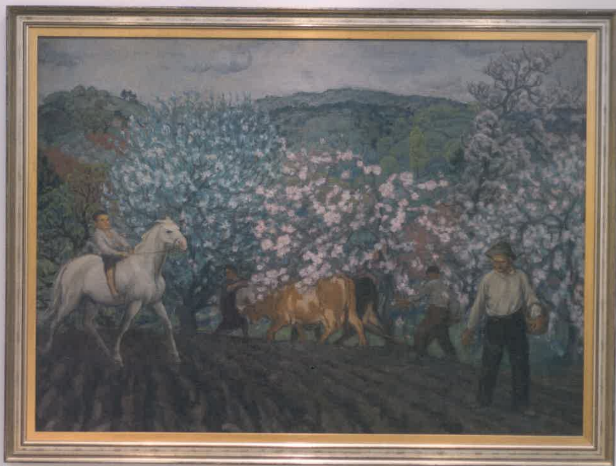
Sobre estos Ilínes, la obra Primavera, de Nicanor Piñole. Abajo, una de las maquetas de Legazpi.

mera de ellas, titulada Pomarada , se refleja cómo se ven las pomaradas durante las diferentes estaciones del año a través de cuatro pinturas. Tres de ellas: Cruzando la pomarada , Recogiendo la manzana y Primavera –cedido por el Museo Reina Sofía, de Nicanor Piñole; y la última, Adán y Eva , de Evaristo Valle. En el centro de la sala se puede ver un auténtico llagar, propiedad de sidra Castañón, rodeado de tres espectaculares maquetas realizadas por Legazpi, procedentes del Museu del Pueblu d'Asturies con las que se completa esta visión y parte del proceso.