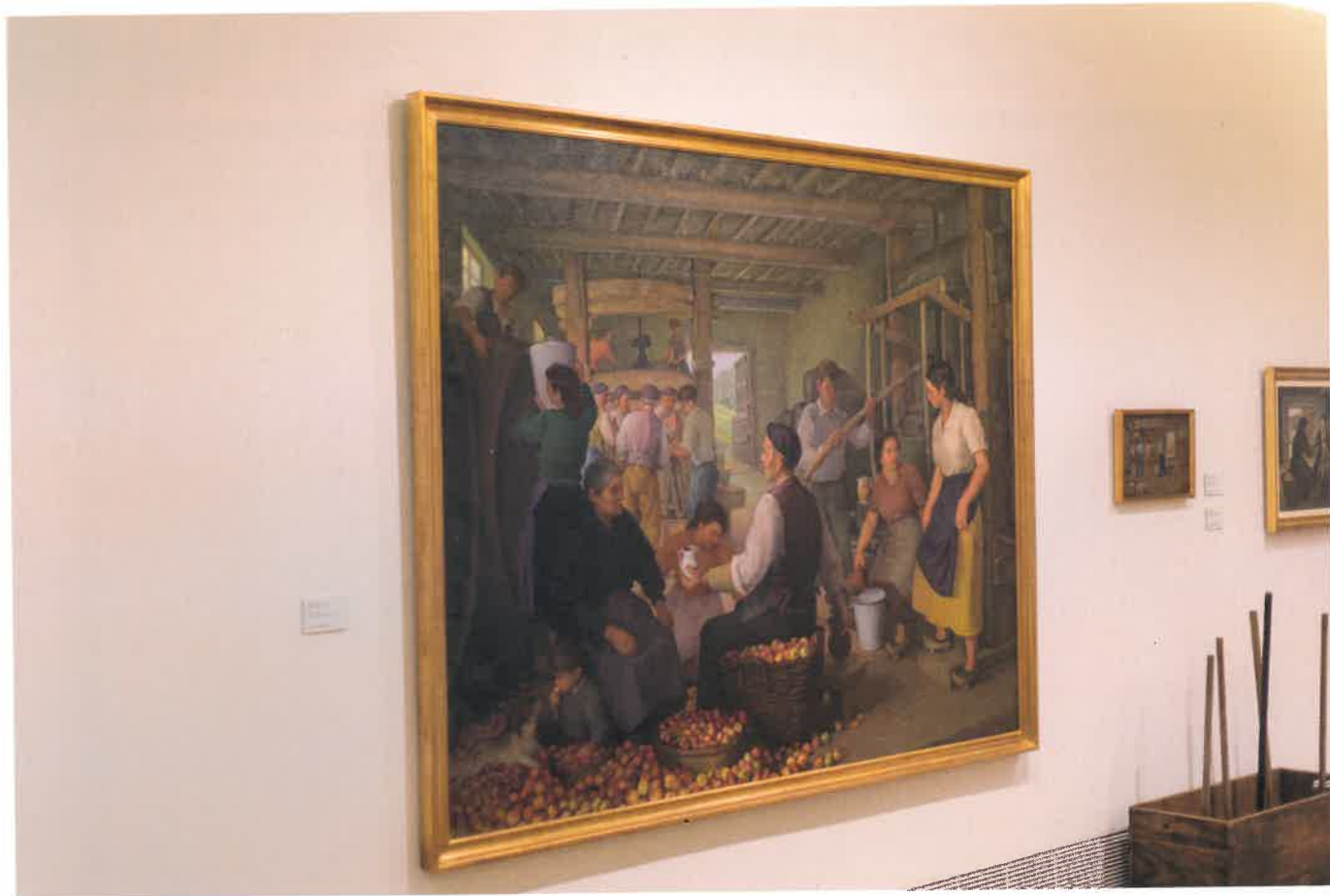
Enriba, en primer términu, el cuadru de Mariano Moré, El Lagar . Abaxo a la esquierda, la escultura Fin de la romería , de Antón Darréu, delles de les botelles y vasos de sidre, rialzaos por La Industria y Gijón Fabril, que potenciaron el desendolcu de fábricas de vidriu nel país.