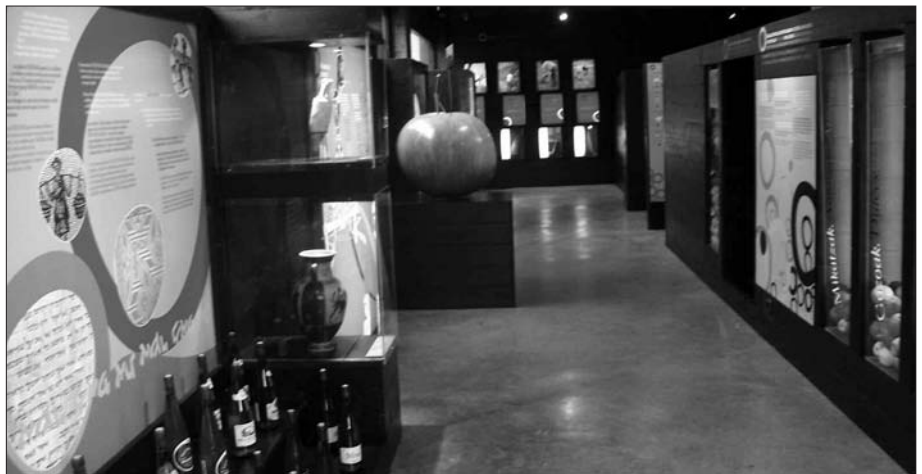
SAGARDOAREN EKOIZPEN PROZESUA NOLAKOA DEN EZAGUTZEKO AUKERA ESKAINTZEN DU ASTIGARRAGAN DEN MUSEO HONEK.

Orditik sagardoaren ekoizpenak gora beherak izan ditu. Beheraldia, bereziki, 60. hamarkada aldean. Arrazoiak beti interpretagarriak diren arren, aditu batek baino gehiagok urte haietan ekoizpenean izandako beherakada edari berrien agerpenekin lotzen dute; Kas edota Coca-Cola marka ezagunekin adibidez.