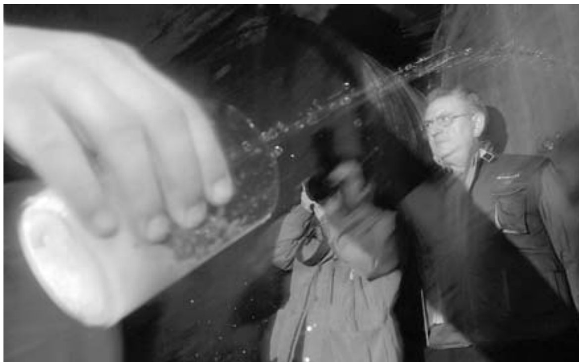
Un asistente a la inauguración prueba la nueva sidra elaborada en Astigarraga.

LEY ANTITABACO Durante la presentación no faltaron alusiones a la nueva Ley Antitabaco y su posible aplicación en los establecimientos sidrereros, lo que evidenció el desco-