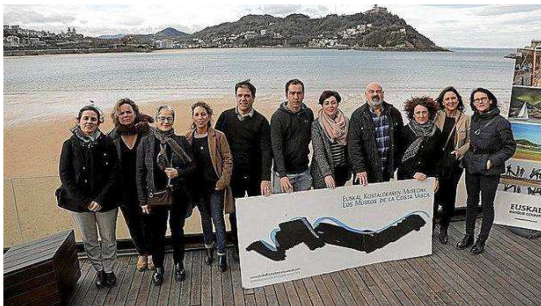
Presentación del mes de los museos de la costa vasca, ayer en Donostia.

Viernes, 2 de Marzo de 2018 - Actualizado a las 06:03h