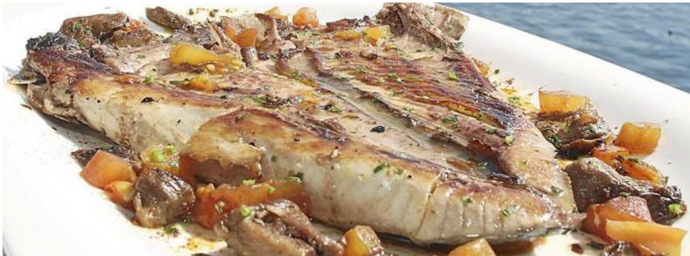
Una ventresca que se puede degustar con vistas a la bahía.