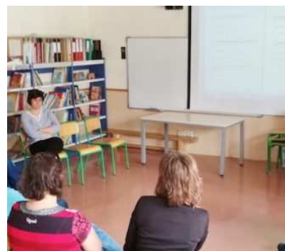
ELIZALDEKO GURASOENTZAKO SEXU HEZIKETA TAILERRAK AHO ZAPORE GOZOA UTZI DU