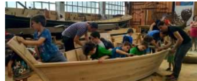
UBERA DEITUKO DA DONIBANEKO BIBLIOTEKA BERRIA, BIHARKO PLENOAREN ONIRITZIAREKIN