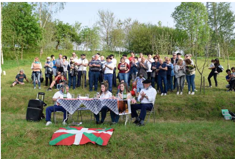
Aurkezpena Arramendi magalean atzo.

Atzo bertan jakinarazi zuen erreferente bihurtu den jaia antolatzeko batzordean orain arte aritu den lan taldeak, antolakuntza utziko duela, eta belaunaldi berriei pasako die lekukoa.