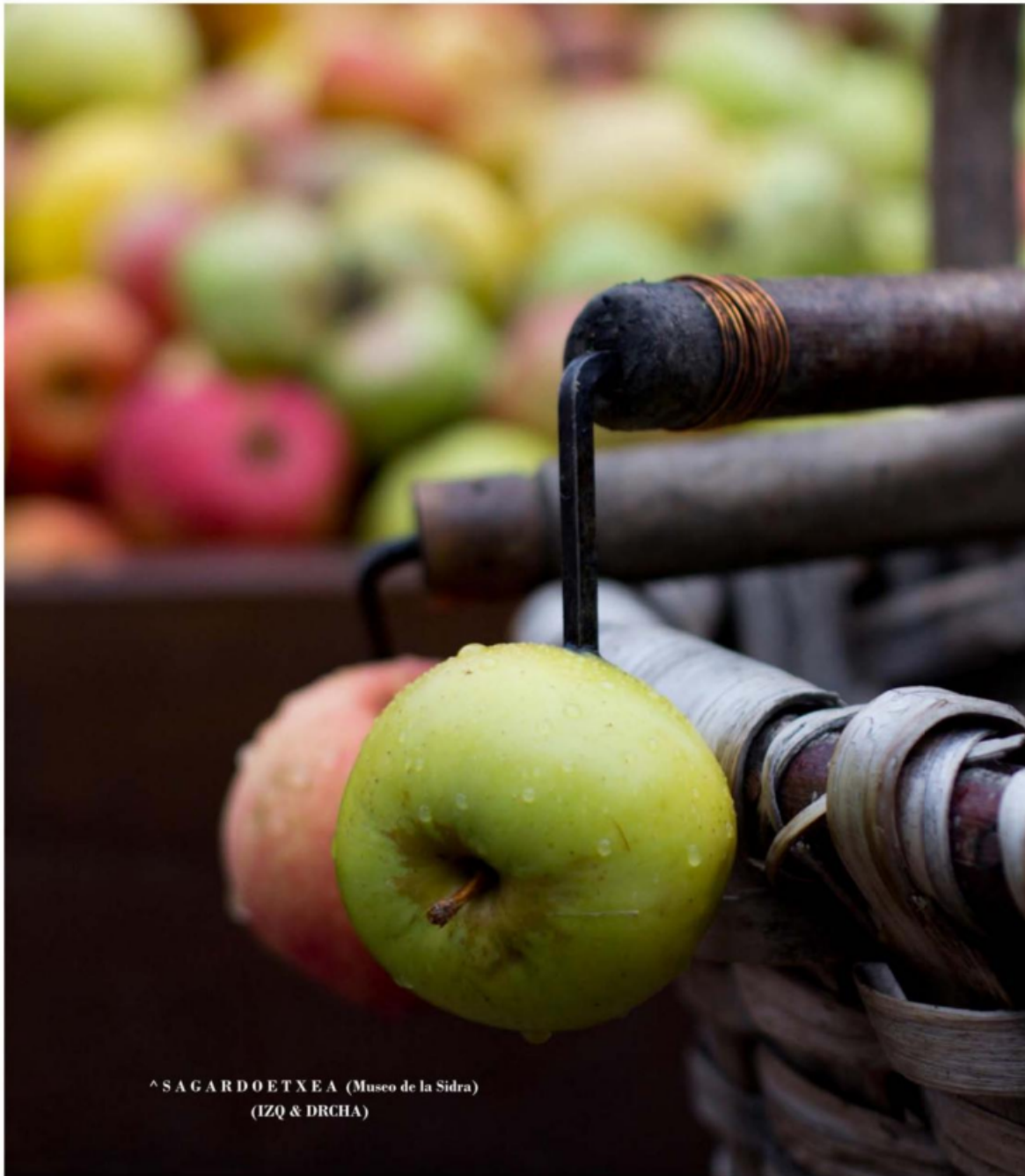
^ SAGARDOETXEA (Museo de la Sidra) (IZQ & DRCHA)