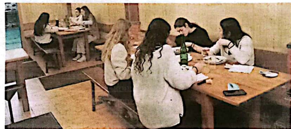
Lau lagunek jan dezakete mahai bakoitzean.