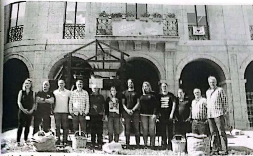
Atzoka, herriko merkatarien, elkarteen eta Astigarragako sagardogileen ordezkariak, atzo.