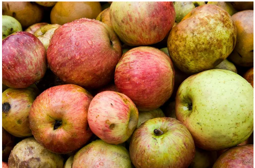
La sidra ( sagardo ) se elabora a partir de manzanas ácidas ( txalaka , goikoetxea , urtebi haundia , urtebi txikia , urdin sagarra y errezila ), amargas ( mozol ) amargas ( monzoloa ).

Una vez concluido el acto protocolario de apertura, decenas de medios de comunicación volvieron a sus quehaceres rutinarios y tuvimos el privilegio de recorrer la comarca de Buruntzaldea para profundizar en la tradición cultural sidrera de Euskadi. Paisaje de belleza extrema a pesar de los rigores invernales, productores cautos al hablar de la nueva añada, tertulias alrededor de kupela : ancestrales, ritos de mesa y mantel con el bacalao y la txuleta como grandes partners de la sidra ( sagardo ), la relación de la s mar, y la txalaparta como instrumento de comunicación entre los distintos caseríos para anunciar el fin de la cosecha son algunas pinceladas que conformarán el guión de una serie de microespacios audiovisuales que iremos subiendo a nuestro blog en los próximos días.