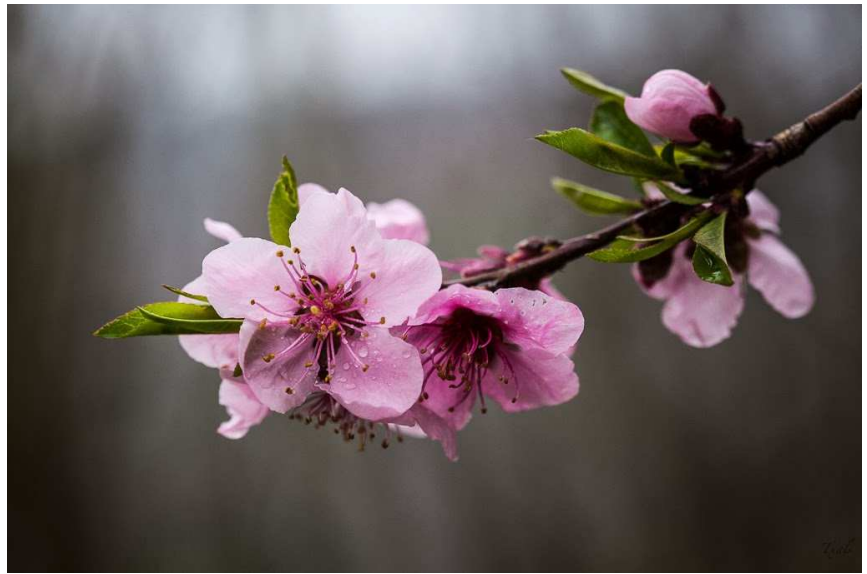
La delicada flor del manzano dibuja el contrapunto en los verdes prados de los caseríos vascos.

Viaja a nuestras raíces... Martindegi 29, Hernani.- 943.555.851