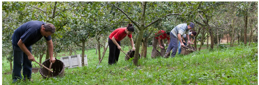
La recolección se sigue haciendo de manera manual.

Para quienes no estén familiarizados con el mundo de la sidra vasca, decir que la sidra natural se consume directamente de una kupela o toneles que suelen ubicarse alrededor del comedor o en una bodega contigua para que los comensales, mientras que dando buena cuenta del menú, se levanten y puedan ir probando los distintos tipos de sidra. Dulce, amarga, ácida... cada kupela magia, al igual que están preñadas de ensueño las instantáneas que ha seleccionado para nosotros el fotógrafo local Txals Her que ilustran esta previa. ¡Ah!, otro detalle... no se pueden perder la cocina que elabora Txaro Zapiain en el restaurante Roxario c Astigarraga. Estén atentos y no se pierdan la refrescante zambullida en un mar repleto de manzanas y sidra natural que hemos | para todos ustedes.