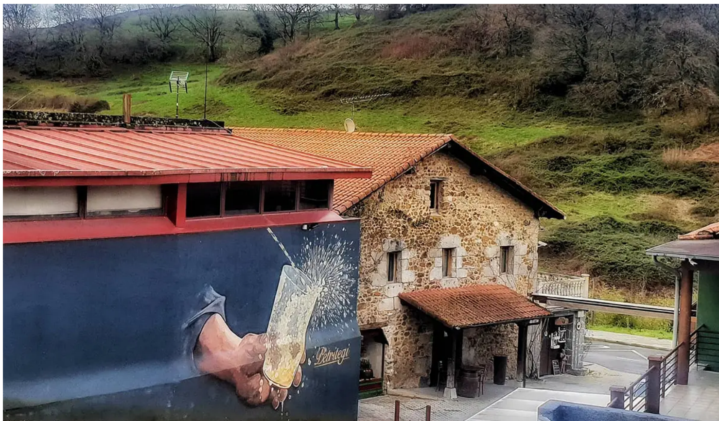
Vista exterior de la sidrería Petritegi, en Astigarraga (Guipúzcoa).

Son ya cinco generaciones las que han pasado por la empresa. Y las que quedan, o al menos esto se deduce al escuchar a quienes actualmente lideran el negocio