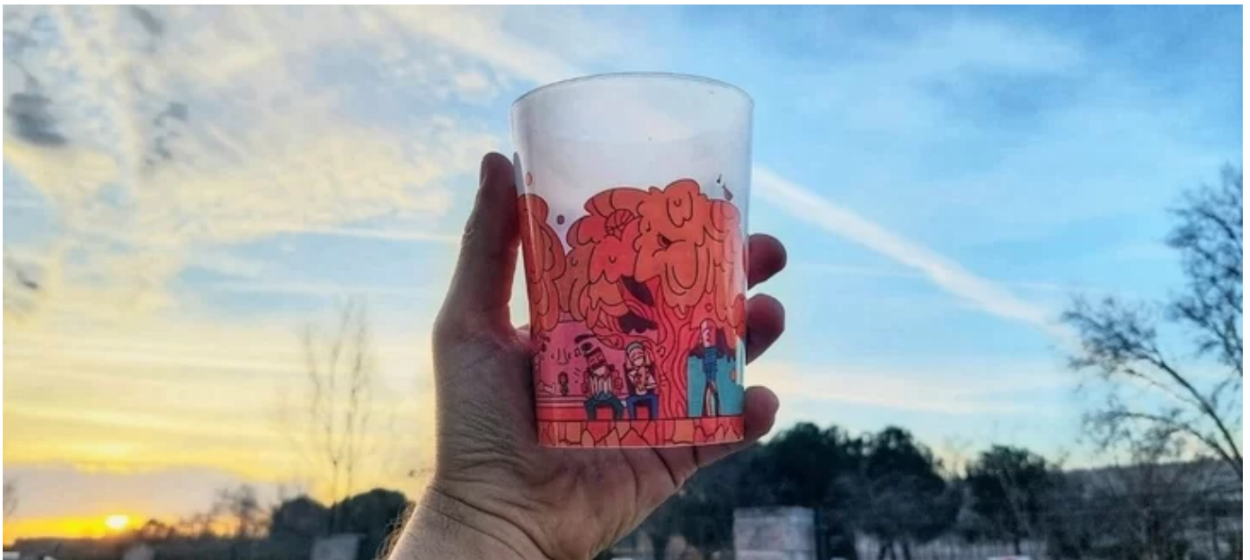
Unai Gaztelumendik egin du edalontzien diseinua. (Hernaniko Udala)

Aurtengo txotx garaian plastikozko edalontzi berrerabilgarriak erabiliko dituzte Hernaniko 15 taberna eta jatetxek. Horrela, ez dituzte edariak plastikozko erabilera