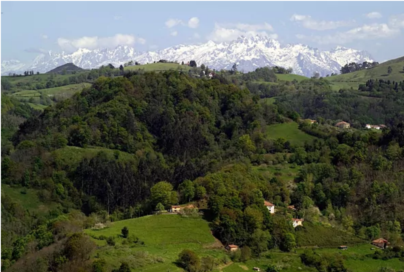
Aldeas de Cabranes.

Conectando con la AS-357, el itinerario llega, tras unos 12 km de carretera sinuosa entre prados, bosques y, por supuesto, plantaciones de manzanos en flor, al concejo Sariego , formado por pequeñas aldeas repartidas en un valle rodeado de suaves montañas. A las afueras del pueblo está la bonita Iglesia Románica de Santa María de Narzana, un pequeño templo en un paraje tranquilo que merece una visita. Volviendo hacia el este, la siguiente parada debería ser el municipio de Cabranes , cuna del mejor arroz con leche de Asturias, no