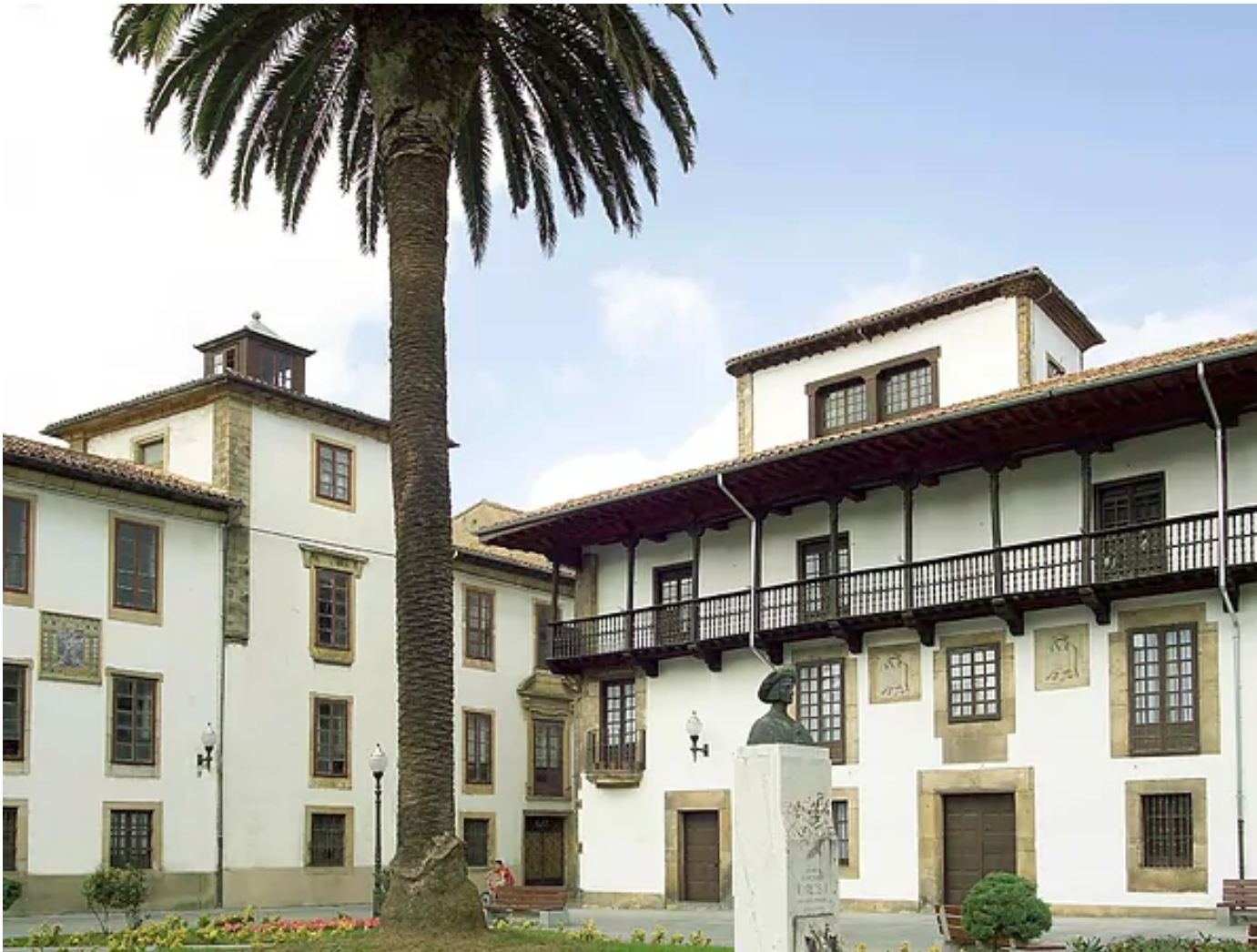
Casco histórico de Villaviciosa.