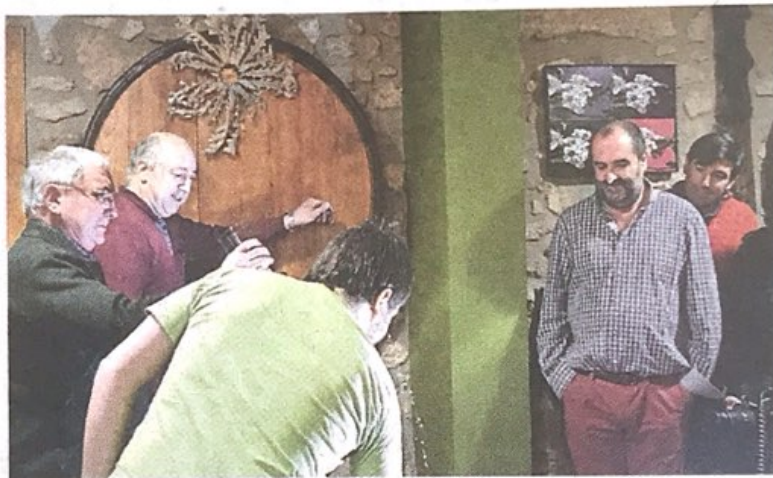
Txotx egiten Askartzako Trebiñu sagardotegian. ARABAKO HITZA