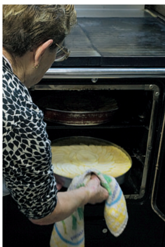
-4- Dejar al horno muy caliente (250 °C) durante 15-20 minutos.