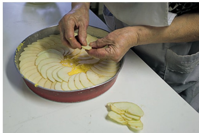
-3- Disponer las rodajas de manzana en dos círculos dibujando una rosa en el centro.