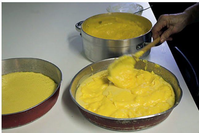
-2- Verter la mezcla en el molde, repartir en toda la superficie. Añadir encima unas veinte cucharadas de crema dibujando una espiral.