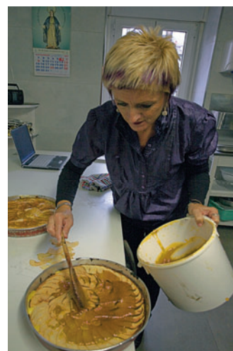
-5- Al sacar del horno untar la tarta con 4 cucharadas de mermelada de albaricoque. Servir templado, cortar directamente en el molde 8 raciones por tarta.

Como anécdota, un cliente del Zubiondo lleva 28 años comiendo todos los días su sagar tarta, con lo cual parece un postre que no cansa !!!