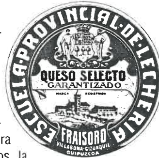
Etiqueta del queso elaborado en Fraisoro.

En estos primeros años de la historia de Fraisoro, los responsables más directos se dieron cuenta de que el desarrollo de la agricultura y ganadería guipuzcoanas se quedaba corto, no pudiendo dar los resultados apetecidos si no se acometía la Formación y Capacitación de los baserritarras. Los avances de la tecnología, de la mejora genética, del manejo de plantas y animales, la utilización de abonos, la lucha contra las plagas y las enfermedades, etc., había que ponerlos al alcance de los profesionales del sector, los baserritarras. Y eso sólo era posible con una buena Formación y Capacitación de quienes tenían que poner en práctica las mejoras y avances que se producían en el sector primario.