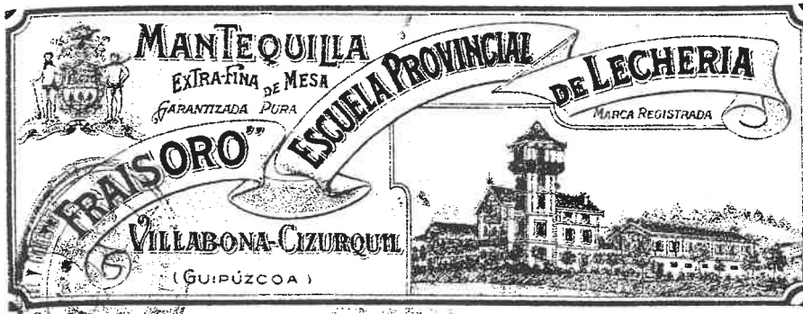
Etiqueta de mantequilla elaborada en Fraisoro.

refrigeradoras, desnatadoras centrifugas, pasteurizadoras, mantequeras, amasadoras, prensas, etc.