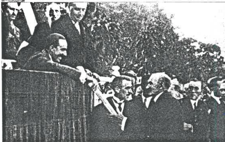
Alfonso XIII entrega el Premio de Honor obtenido por Fraisoro en el IV Concurso de Ganado de 1922.

ron en Fraisoro los cursos de: Capataces de Cultivos, Capataces de Lechería y Capataces de Sidrería.