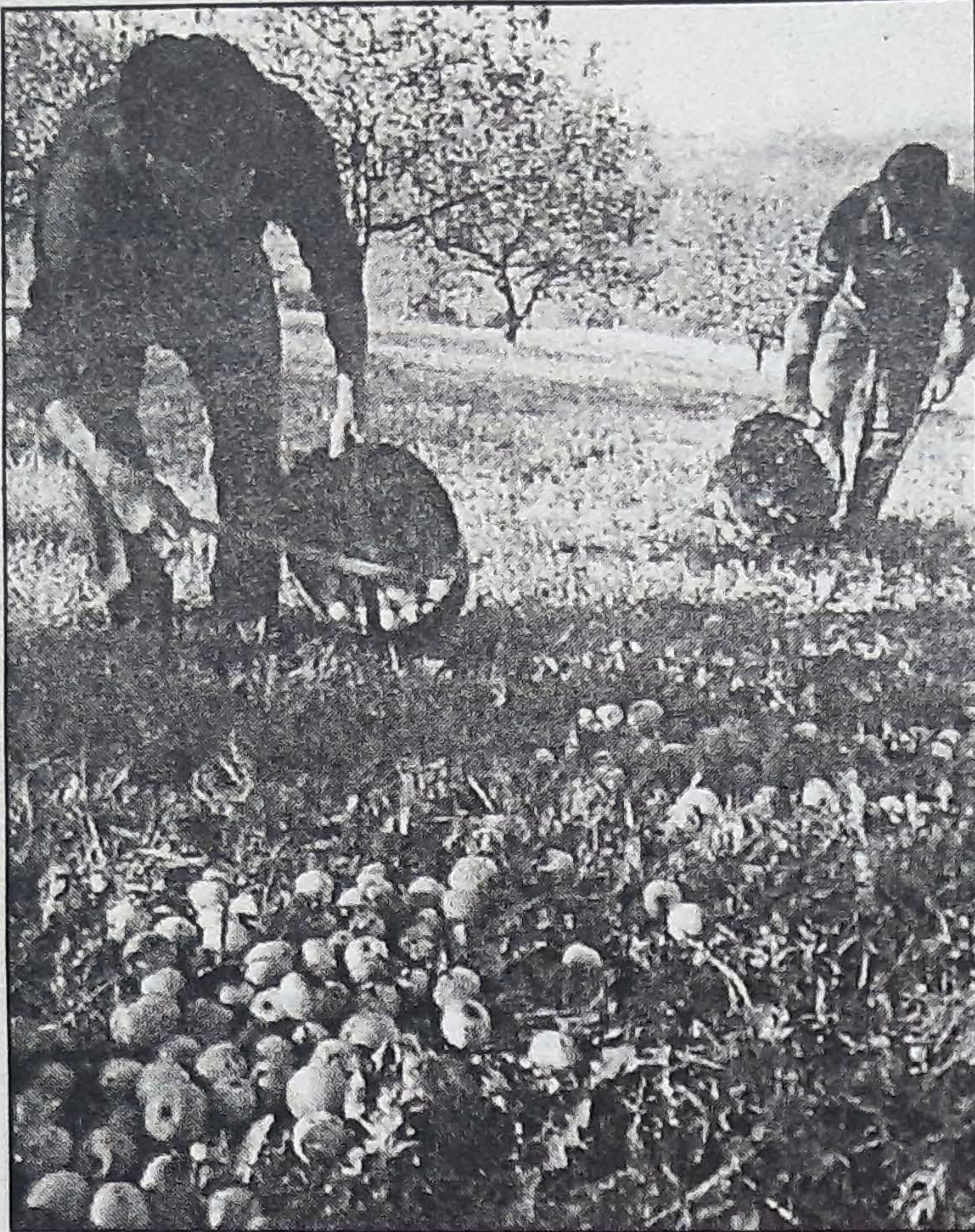
Oso zaila da egun jakitea zein prezio ordaintzen diren sagar kilo bakoitzeko.

Akordioak hartzen direnean sagar ekotzle guztiak zaku beren sartzen direla dio Zapiainek, eta euren elkartaren ustez ez duela horrela izan behar. «Ez da berdina bere erara lan egiten duena, nahi duen sagar mota lantzen duena, nahi duenean biltzen duena eta kanpaina barruan baldintza batzuk betetzen ez di-