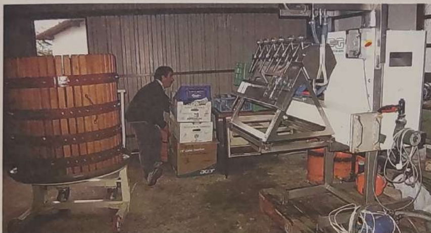
AUTOKONTSUMOA Momentuz, baserriak autokontsumorako ekoizten dute zukua. ESTITU IMAZ

pozgarria da ikustea badagoela gogoia baserriari eusteko eta dagoenari etekina ateratzeko. Proiektua lau katuren arteko gauza ez da izan, herrian hedatu baita, eta Ezkio inguruko hogeita bat baserriak esku hartu baitute bertan; «gehieneko kopurua 30ean zehaztu genuen, eta oraindik ere beste zenbait proiekturakin bat egingo dutela uste dugu», zehaztu du.