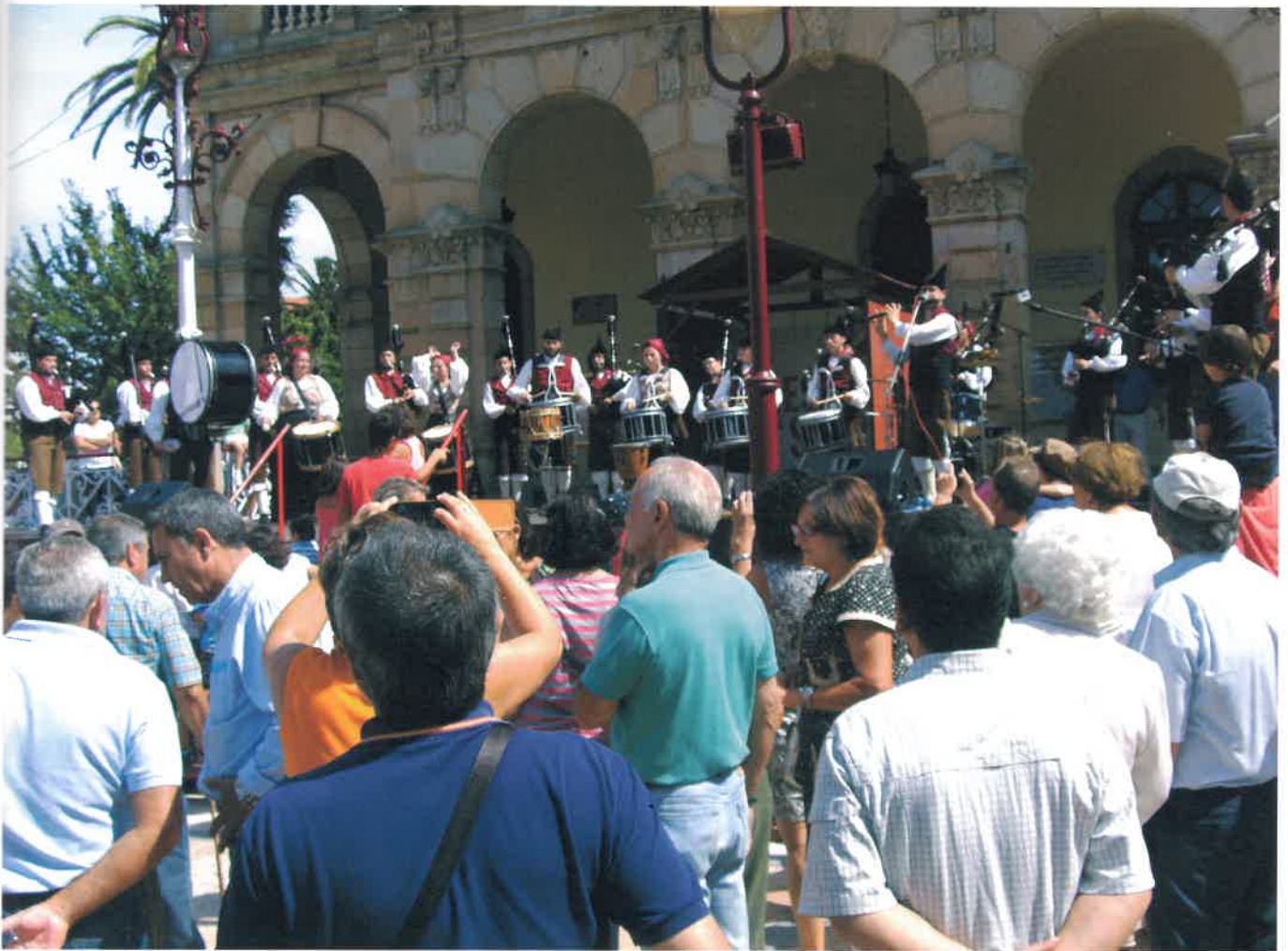
Nes villes y pueblos les fiestas de la sidre aïden a caltener la folixa y la vida social de la so contorna.

Anguaño tamos viendo fiestas gastronómiques nes que lo que más destaquen ye'l calificativu "d'interés turísticu"; reportaxes na prensa nacional alrodiu les, según dicen, meyores sidrerías; guíes con rutes turístiques; y toa triba d'oxetos empobinaos a los visitantes foriatos. Daqué que nun tien por qué ser malo si nun lo lleven a un estremu como'l casu de ver que sidrerías de les denomaaes de tola vida tan camudando en restoranes que tamién dícense de xinta tradicional y nos que cada vegada son menos los veceros del so barriú. El centru les ciudaaes ta enllenu d'exemplos, quedando les sidrerías arrinconaaes a otres cais perifériques onde los sidreros avezaos atópense muncho meyor.