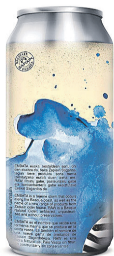
ZAPIAIN. Zapiain sagardotegiak ekoizten duen Enbata Raw markako latak sagardoa. ZAPIAIN