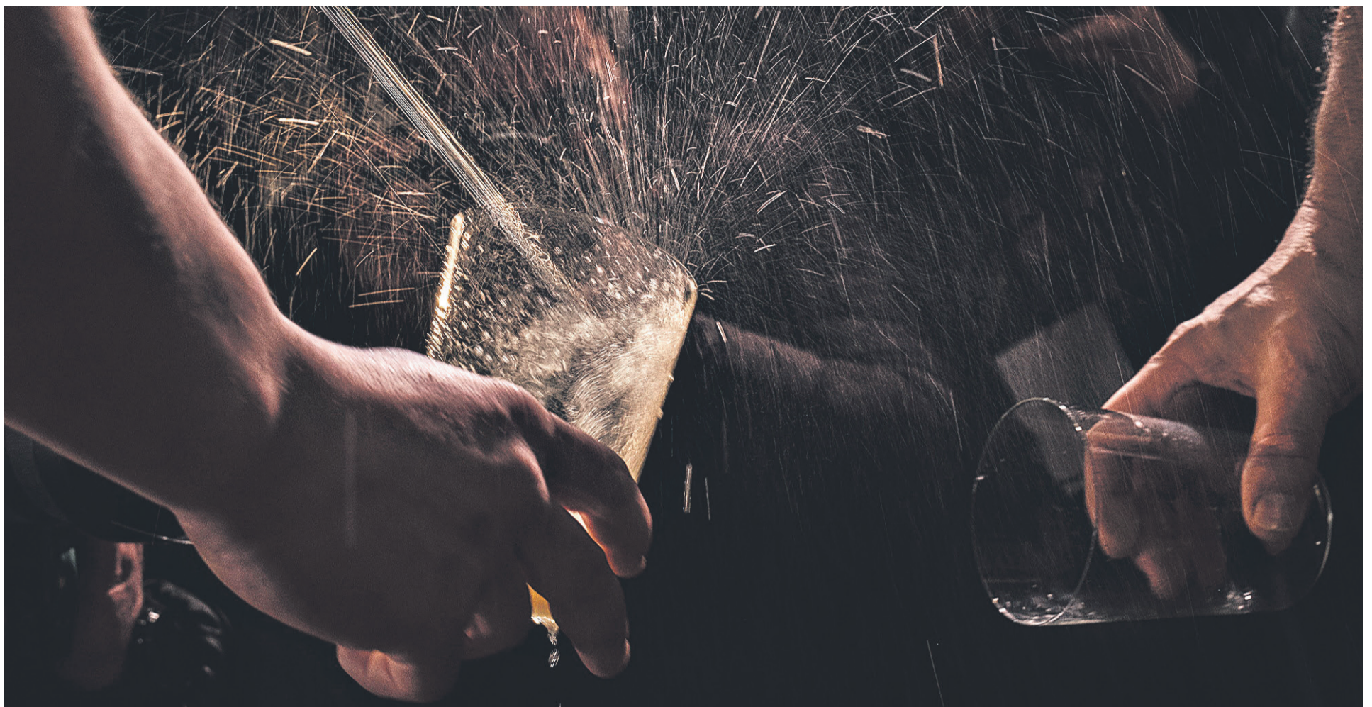
SAGARDOTEGIAN. Bi lagun txotx egiten, Astigarragako (Gipuzkoa) Alorrenea sagardotegian.