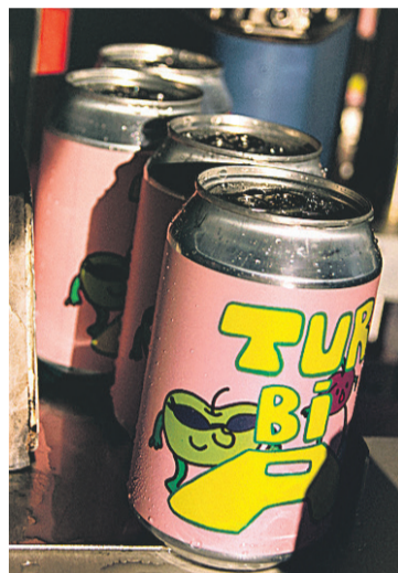
BIZIO. Turbia markako latak sagardoa. BIZIO