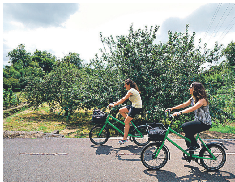
BIZIKLETAN. Bi lagun, bizikletan ibiltzen, Sagarbike esperientzian. SAGARDOAREN LURRALDEA

da. Goxokatak, berriz, usainekin jolastu eta Euskal Herriko produktu gastronomiko berezietan gozatzeko aukera eskaintzen du: sagardo naturala Idiazabal gaztarekin, sagardo aparduna sagar gozoa eta intxaurrarekin eta Bizi-Goxo izotzeko sagardo gatz duen txokolatearekin. Sagarbike esperientziak, berriz, bizikletan ibilaldia egiteko aukera eskaintzen du, eta Sagardoa eta Itsasoa esperientziak sagardoak itsasorekin duen lotura historikoa ezagutzeko.