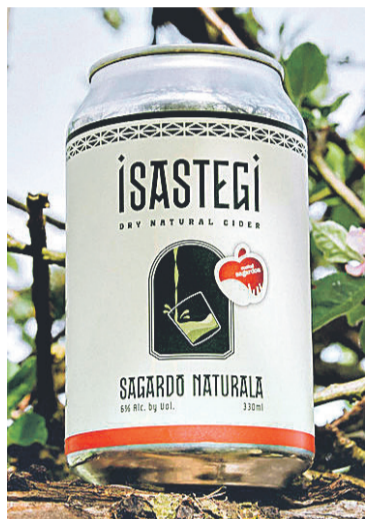
ISASTEGI. Isastegi sagardotegiaren latak sagardoa. ISASTEGI

Ameriketako Estatu Batuetan erabat ohikoa da sagardoa latan edatea. Euskal Herrian, berriz, oraindik ere gutxi dira bide hori probatu duten sagardogileak.