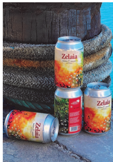
ZELAIA. Zelaia sagardotegiaren latak sagardoa. ZELAIA