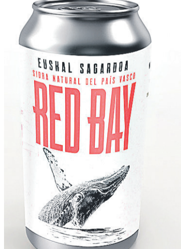
SAIZAR. Saizar sagardotegiaren Red Bay sagardo naturala. SAIZAR

E uskal Herrian pixkaka ari da zabaltzen sagardoa latan edateko ohitura. Gero eta jende gehiagok edaten du sagardoa latatik. 2019. urtetik hona, hainbat sagardogile sagardoa latan merkaturatzen hasi dira, bai sagardo naturala, bai beste sagardo mota batzuk ere. Besteak beste, sagarraren bidez egindako edari freskagarriak, Euskal Sagardoa sor-markako sagardoak, lupuluarekin hartzitutako sagardoak, eta limoia, okarana eta gerezia frutekin egindakoak.