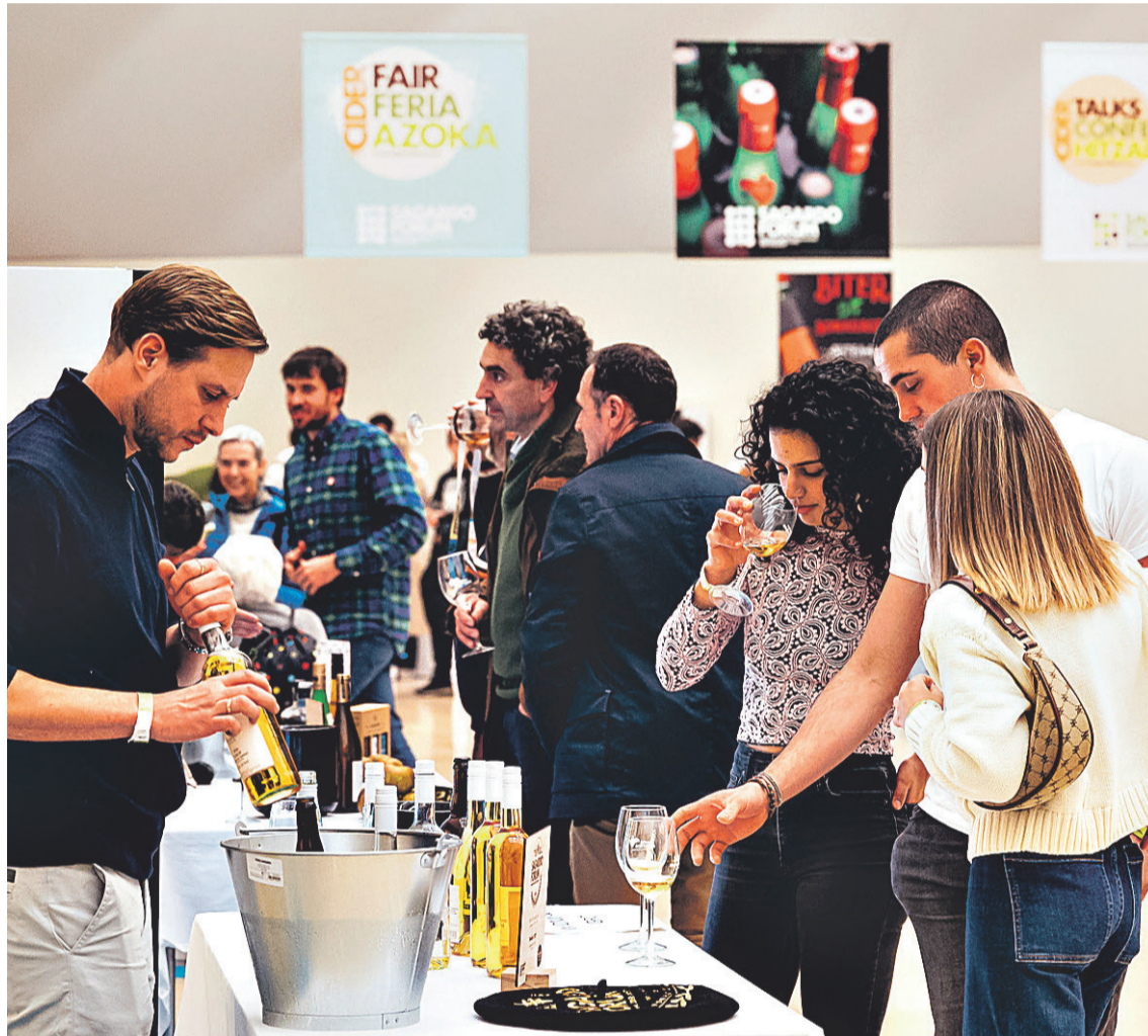
AZOKA. Hainbat lagun, sagardo mota batzuk dastatzen, V. Sagardo Forumean antolatutako Nazioarteko Sagardo Azokan. SAGARDOAREN LURRALDEA

Halaber, arrakasta handia izan zuten V. Sagardo Forumean izan ziren jarduerak ere. Horietako bat, Donostiako Tabakalera-