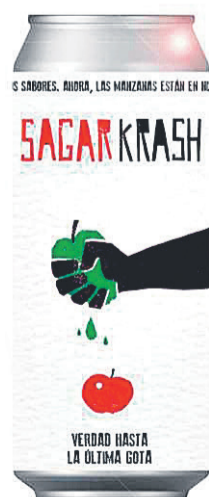
PETRITEGI. Petritegi sagardotegiaren Sagarkrash Sagarra, Sagarkrash Limoia eta Sagardo Naturala latak sagardoak. PETRITEGI