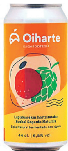
OIHARTE. Lupuludun Euskal Sagardoa. OIHARTE