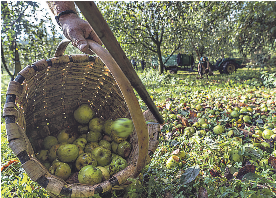
BILKETA. Kizkiarekin sagarrak biltzen, Hernaniko (Gipuzkoa) Iparragirre sagardotegia- ren sagastian.