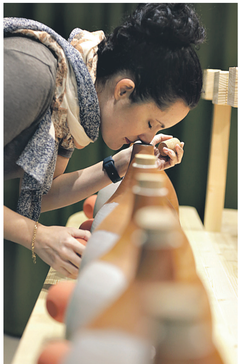
USAIMENA. Bisitari bat, Sagardoetxea Sagardoaren Museoan usaimen gunean. SAGARDOAREN LURRALDEA

Horiez gain, sagardoaren kulturaz gozatzeko planak eta jardura bereziak eskaintzen ditu Sagardoetxeak urte osoan. Horien artean, Museoa eta Sagardotegia esperientziak museoko bista eta sagardotegiko otordua uztartzen ditu, eta esperientziarik salduena