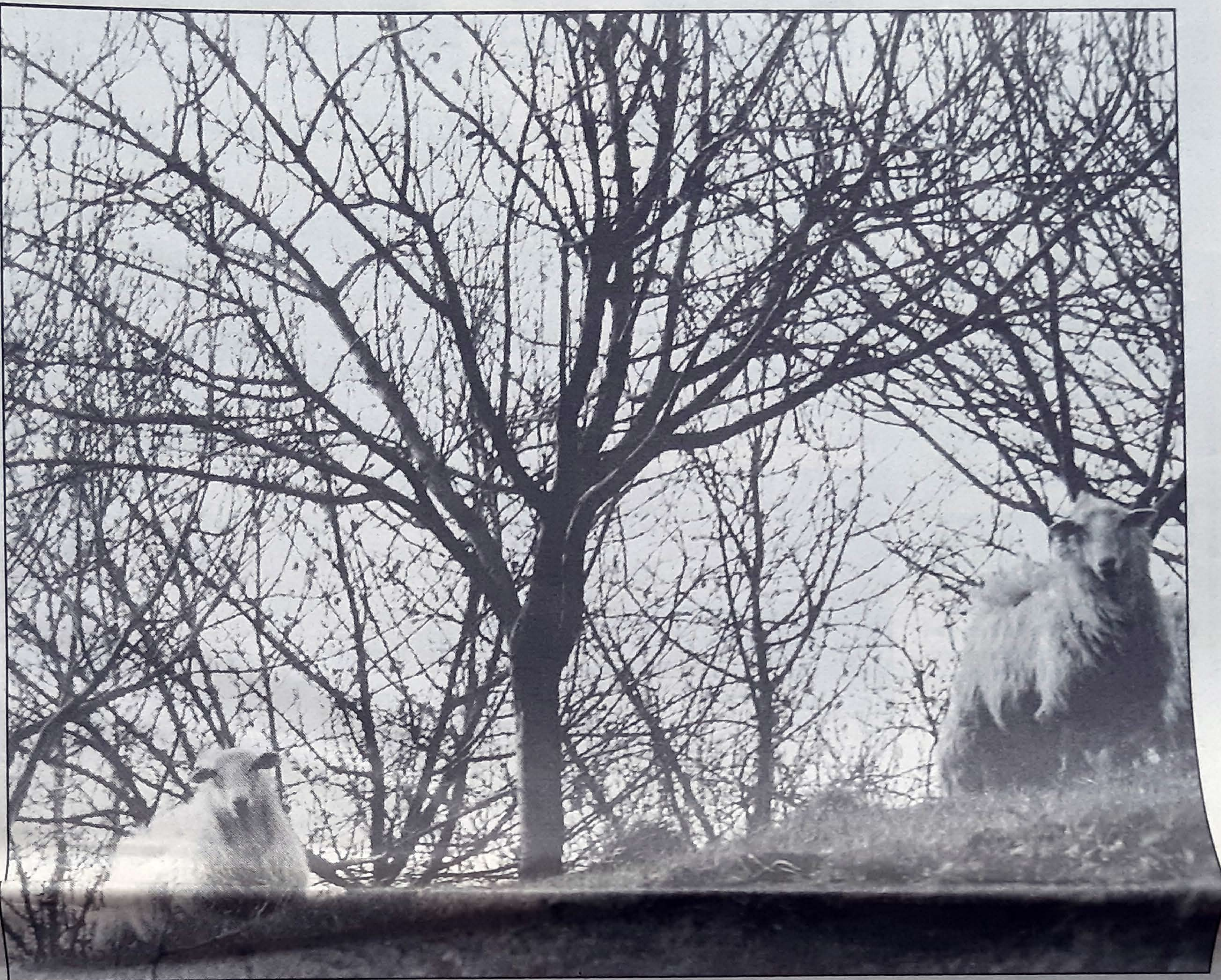
Sagardogintza aldatzen ari bada ere, oraindik baserriari loturik dago.

Sagardogintzan azken urte hauetan aldaketa ugari izan dira. Horietakoa bat metalezko kupe-