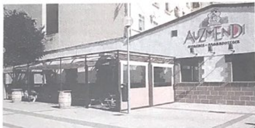
SAGARDOTEGIA. Iruñeko Auzmendi sagardotegia. AUZMENDI

Nafarroako aurtengo txotx garaia Lesakako Linddurrenborda sagardotegian zabaldu zuten, urtarrilaren 10ean.