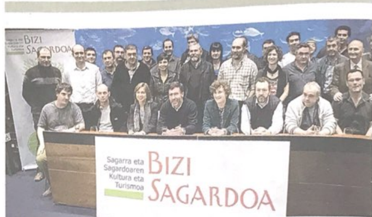
AURKEZPENA. Bizi Sagardoa elkarte aurkezteko ekitaldia, iaizo apirilaren 15ean, Donostian.