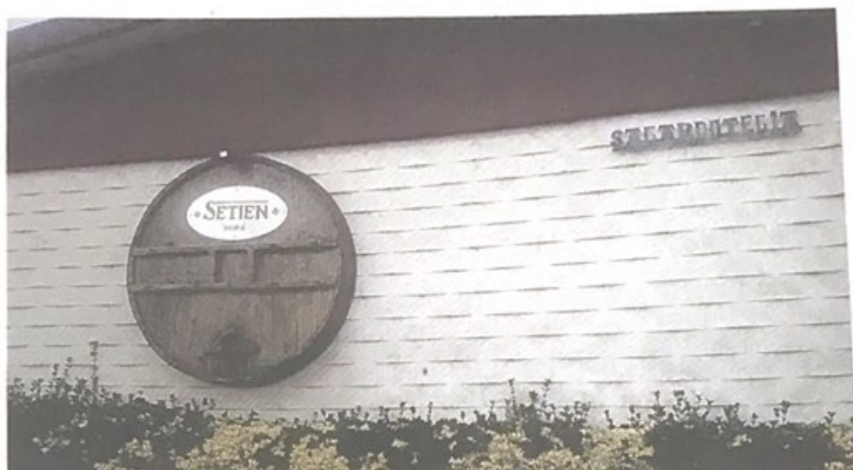
SAGARDOTEGIA. Urnietako Setien sagardotegiko aurrealdea. SETIEN