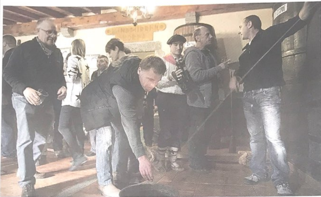
DASTATZEN. Sagardo berria dastatzen, Lesakako Linddurrenborda sagardotegian, urtarrilaren 10ean.