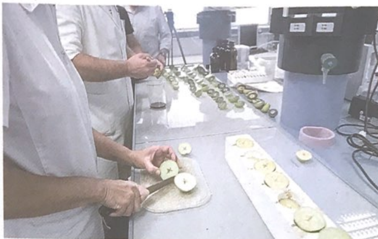
DASTATZEA. Zizurkilgo (Gipuzkoa) Fraisoro Landa eta Ingurumen Laborategiko teknikariak sagardoak dastatzeko arduratzen dira.

Euskal Herriko Unibertsitatea, Gipuzkoako Foru Aldundiko Landa Garapenerako Departamentua eta Gipuzkoako Sagardogileen Elkarteak sagar mota bakarreko sagardoak egiten ari dira, sagar mota bakoitzaren ezaugarriak ikertu eta ezagutza zabaltzeko asmoz.