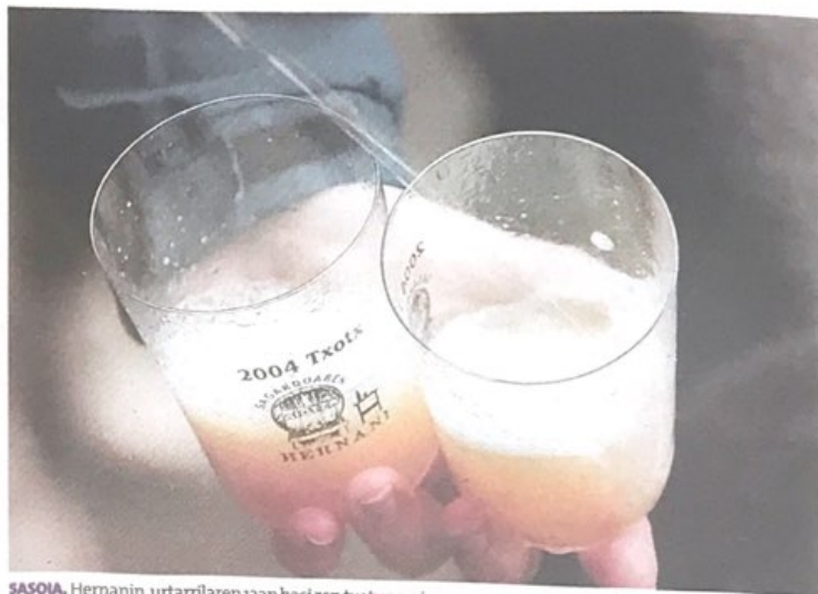
SASOIA. Hernanin, urtarrilaren 12an hasi zen txotx garaia.