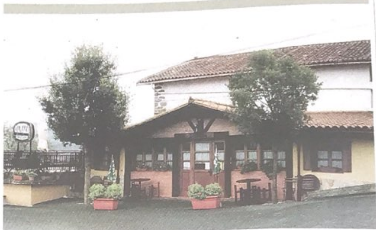
OTATZA. Olatza sagardotegiaren aurrealdea. OTATZA