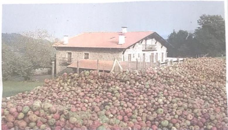
OIHARTE. Oiharte sagardotegia: baserria eta sagarrak. OIHARTE