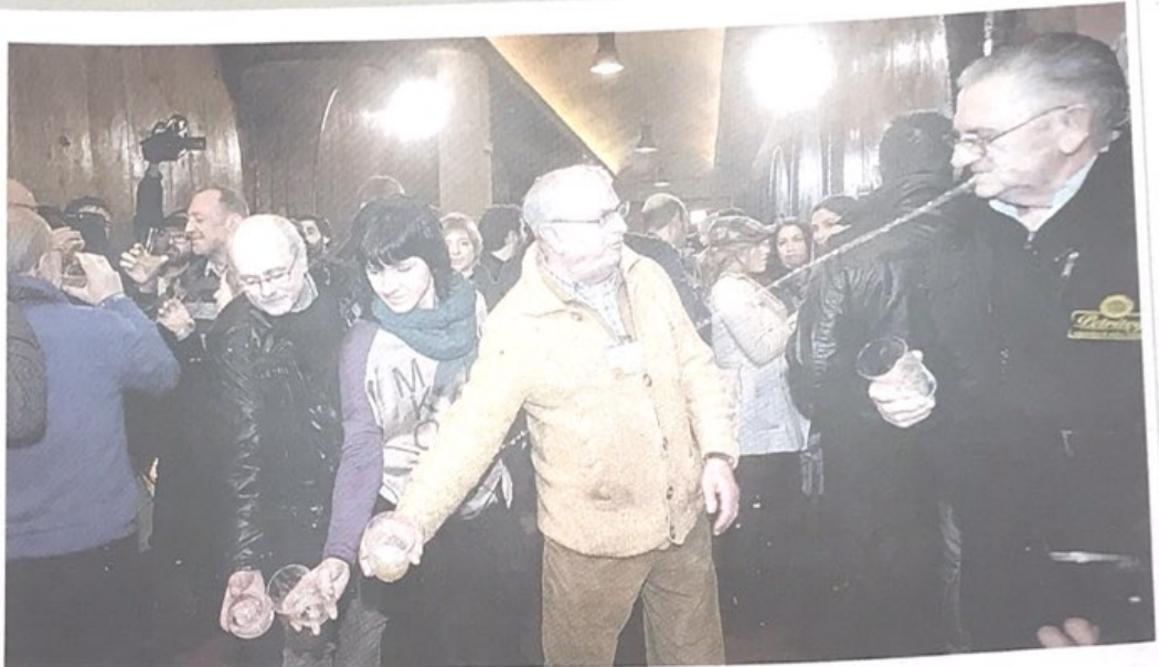
HASIERA. Iazko txotx garaia irekiera Astigarragako Petritegi sagardotegian.

Sagardotegiak Euskal Herrian bakarrik daude. «Munduan dagoen horrelako esperientzia bakarra da gurea, eta egunetik egunera Euskal Herritik kanpoko jende gehiago etortzen da sagardotegietara».