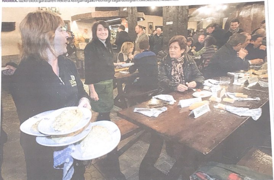
MENUAK. Bakailao tortillak banatzen, giro ederrean.