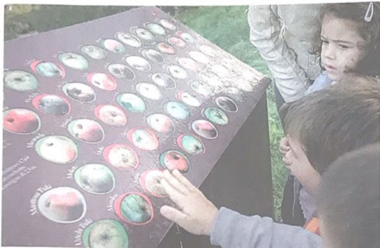
BISITA. Bisita gidatu bat, Sagardoetxea museoan.