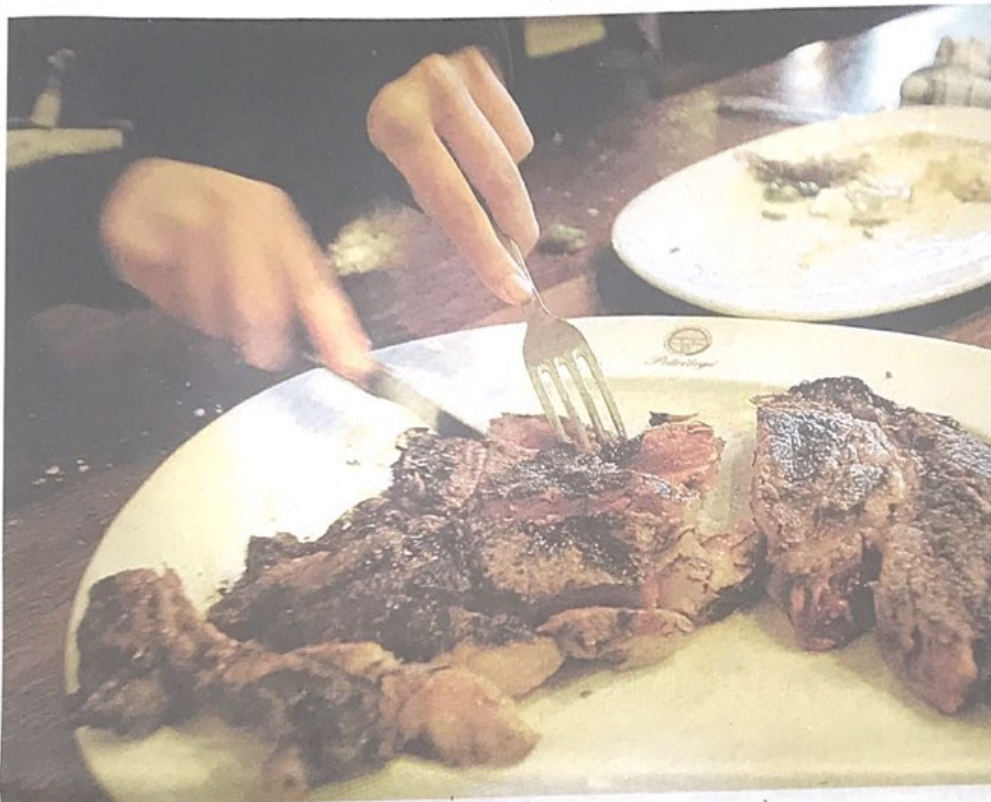
TXULETA. Txuleta eder bat dastatzen, Astigarragako sagardotegi batean.