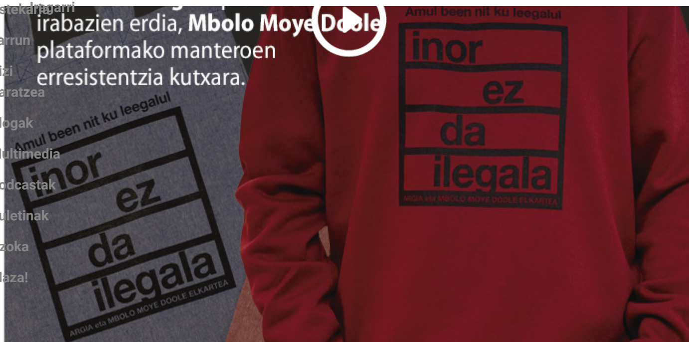
Inor Ez Da Ilegala proiektuko produktuak ARGIAren Azokan eskuragarri