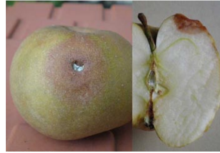
Manzana alterada tras un ataque de carpocapsa

Las esporas de estos mohos están presentes en la fruta (manzanas, melocotones, peras) pero únicamente son visibles tras la recolección. No obstante, además de en frutas