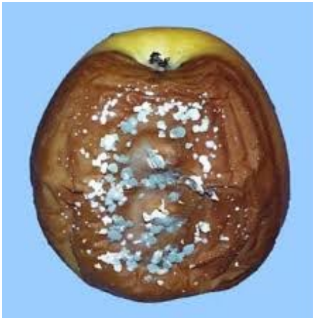
Manzana tocada por el penicillium expansum

La patulina es un metabólico secundario proveniente de varias especies fúngicas del género Penicillium , Aspergillus y Byssochlamys , y en peculiar P. expansum (podidumbre azul de las manzanas), que es la especie la más frecuente.