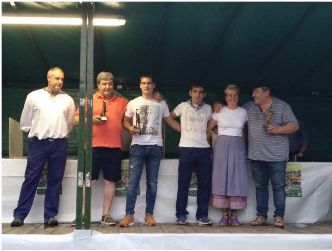
Iturria: Urola Kostako Hitza