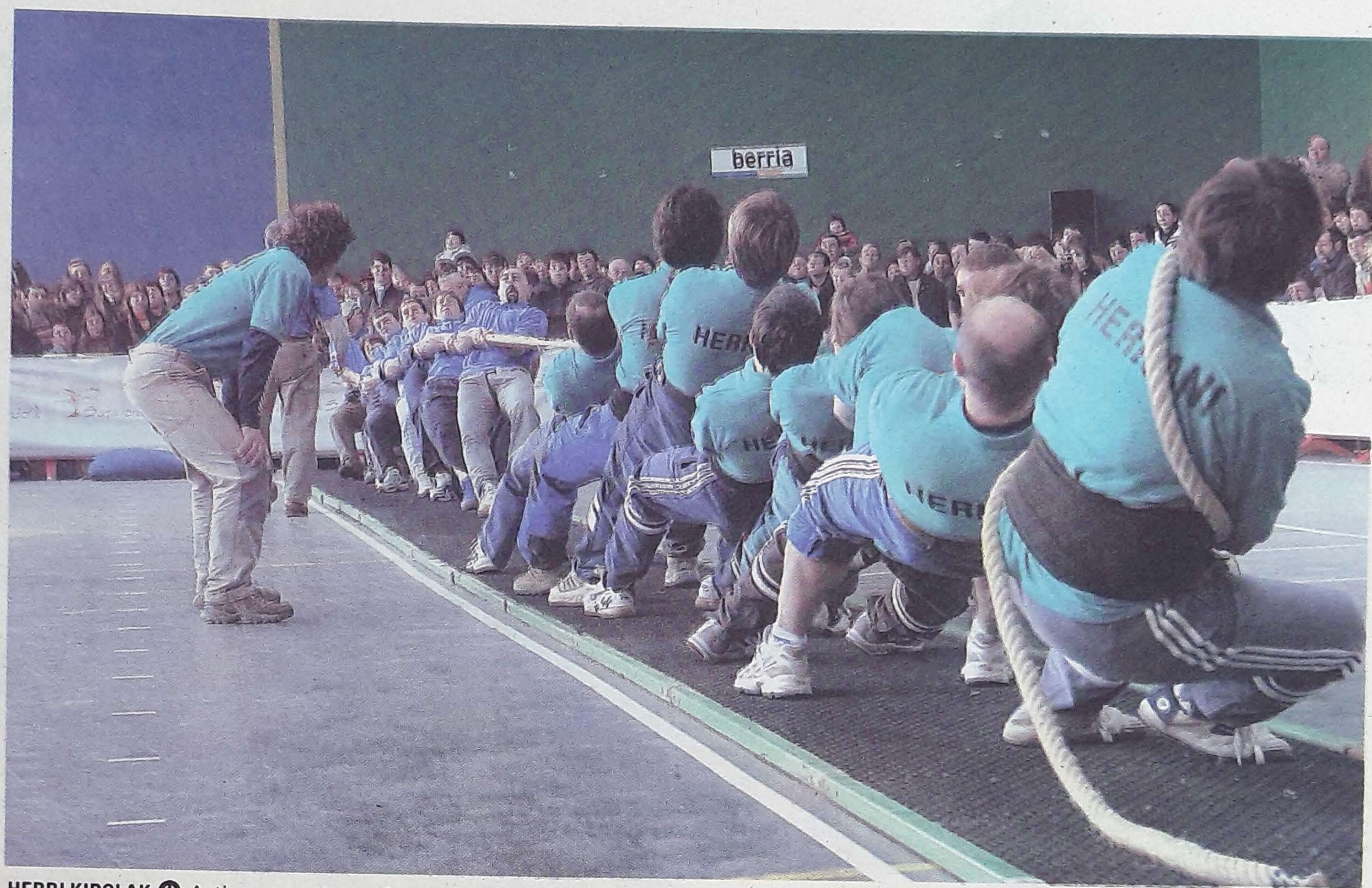
HERRI KIROLAK Astigarraga, Hernani, Urnieta eta Usurbilgo herritarrek lehia egiten dute kiroletan.

Ostiralean eta larunbatean, berriz, Hernanin izango dira gazteentzako kontzertuak. Aurten instalazio egokiagoak bilatzen saiatuko dira: aurreko urteetan