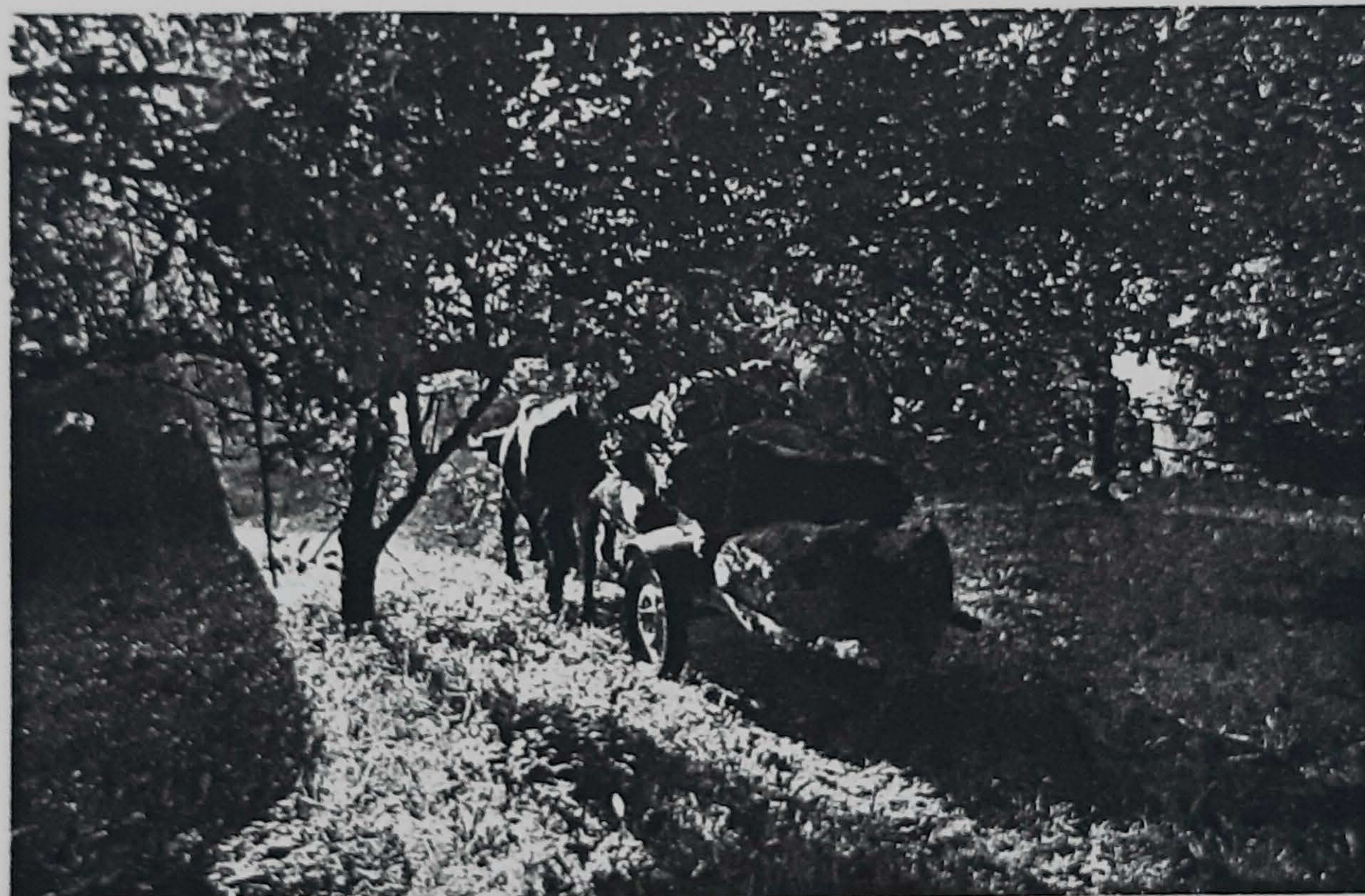
■ Kanpoko sagardotegi jabeek Euskal Herriko sagardoa eta jaki bereziak erosten dituzte beren sagardotegietarako.

Euskal Herriatik kanpora egotean, "Aurrera" sagardotegikoek ez dute arriskatu nahi izan eta tipikoa den menua topa badezakegu ere, bestelako menuak ere aurki daitezke. «Euskal Herrian ez gaudenez,