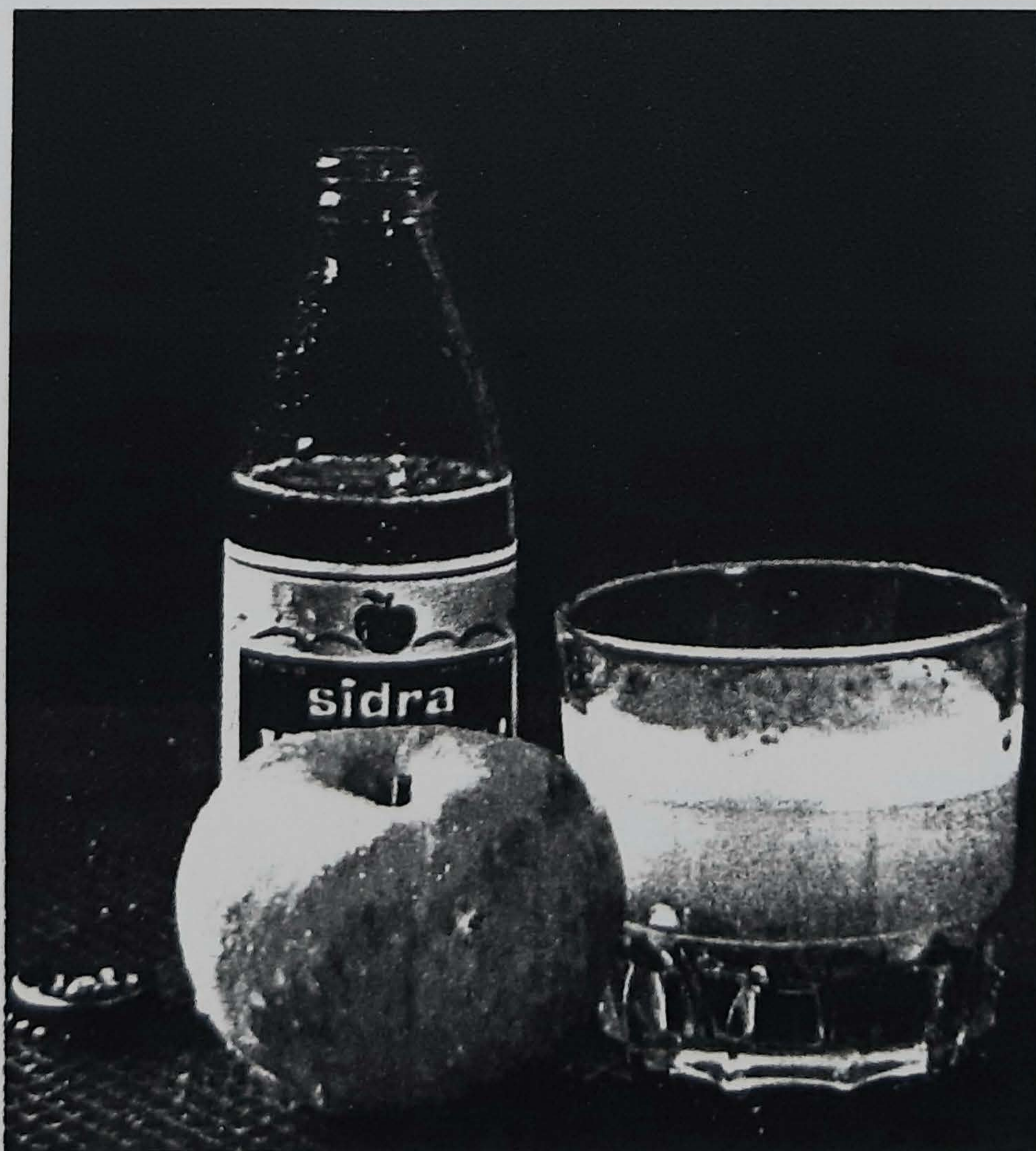
■ Gure sagardoak mugak hautsi ditu eta Estatuan hainbat adibide ikus ditzakegu

Jakiei dagokienean, « guztiak Gipuzkoatik erosten dituzte, kalitate oneko jakiak direla uste baitugu eta horren aldeko apostua egin behar da».