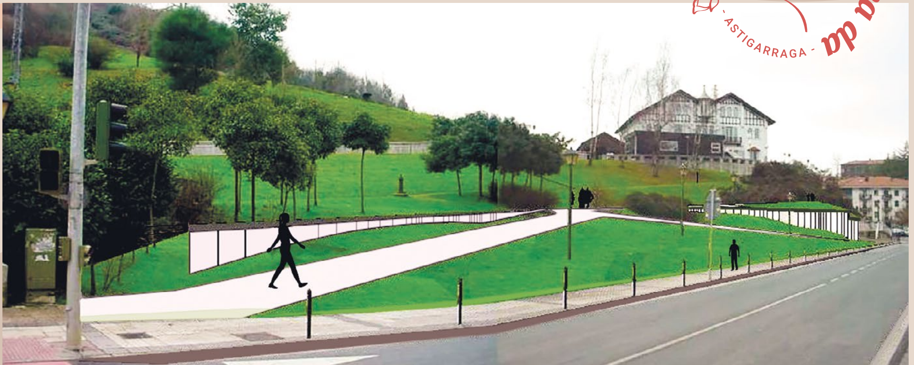
Kokapena: Herriaren erdigunean, sagastia errespetatuz.