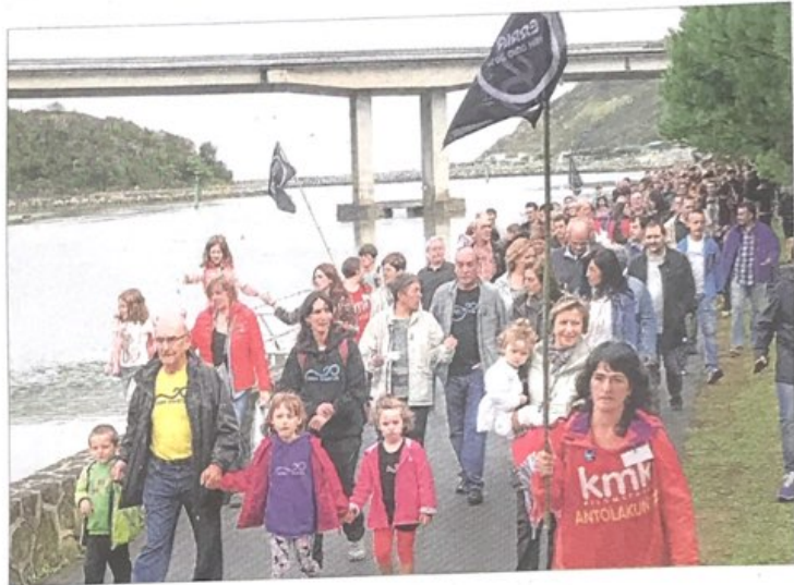
Orion egin zen Kilometroak festan sinatu zuten akordioa.

Ikastolen Elkarteak eta Euskadiko Sagardogileen Federazioak elkarlanerako akordioa sinatu dute