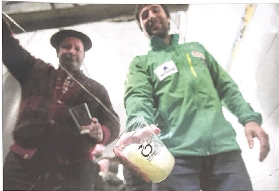
Bizkaiko sagardogileek bertako sagarrak erabiltzen dituzte. Aurtengo sagardoa arina eta kalitate onekoa izango da.

Urtez urte eginiko lanaren ostean, gero eta babes handiagoa du sagardoaren kulturak herrialdean. Egun, hamar ekoizle daude Bizkaian: Etxebarria (Gatikako Txone-Barri baserrian), Leartibai kooperatiba (Gizaburuagan),