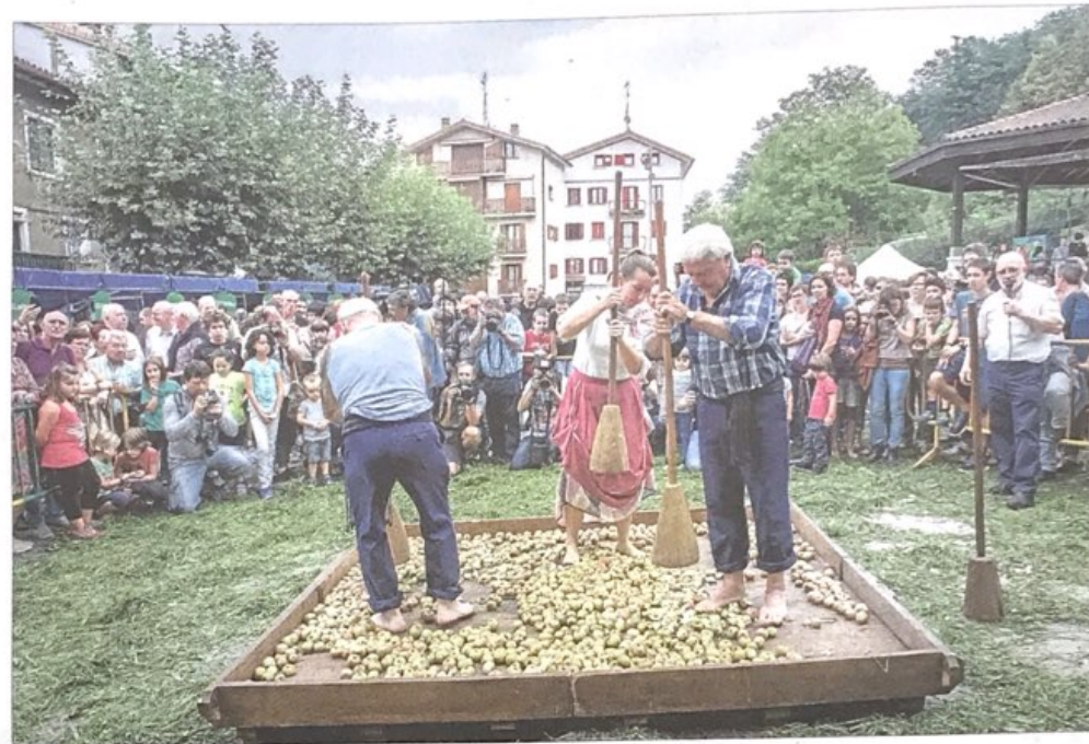
Nahiz eta lazko uzta oso ona ez izan, ia 13 milioi litro sagardo egin dira Euskal Herri osoan.

Bizkaian 150.000 litro egin dira 2014 uzتان, %100 Bizkaiko sagarrarekin, Bizkaiko Sagardogileen Elkarteak ( www.bizkaiko-sagardoa.com ) jakitera eman duenez. Durangaldea, Busturialdea, Uribe Kosta, Txorierri eta Leartibai dira sagarra jasotzen duten eskualdeak eta ho-