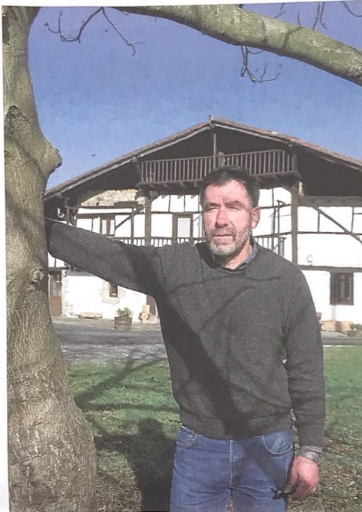
LAGUN (SAGARDOTEGI)

Baserrira bere osotasunean hartzea komeni da, ez sagardoa edo sagardogintza beren horretan bakarrik; erakutsi egin behar da, jendeari azaldu egin behar zaio zein den gure lana, nola egiten dugun guztia, bestela ez dago etorkizunik. Uztartu egin behar dira turismoa eta lana; eta turismoa diogunean, ez gabilta kanpotarrei buruz bakarrik, bertako-