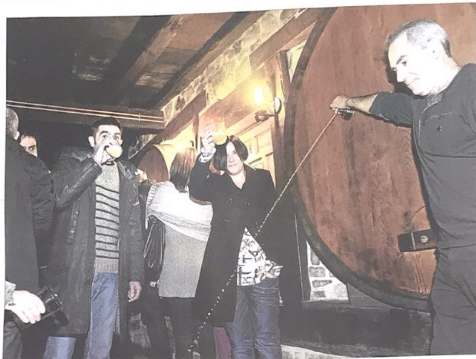
Txotx inaugural del pasado año en la sidrería Iturrieta, de Aramaio.

El objetivo de la asociación Arabako Sagar eta Sagardogileen Elkarte ha sido desde el principio producir una sidra propia. Para ello, tienen que superar algunos obstáculos y dificultades. La sidra de Araba es ecológica, y por lo tanto, la ma-