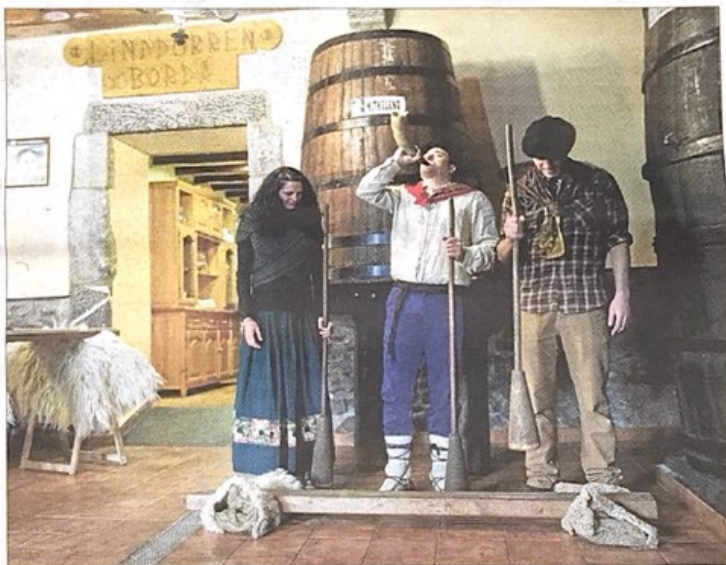
Iaz Linddurrenborda sagardotegian egin zuten txotx denboraldiaren irakiera.