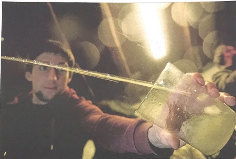
Sagardo berria prest da dastatzeko eta gozatzeko. Orokorrean, usaintsua, arina eta txinparta finekoa da.

Urtean, 800.000 bisitari inguru izaten dituzte Euskal Herriko sagardotegiek