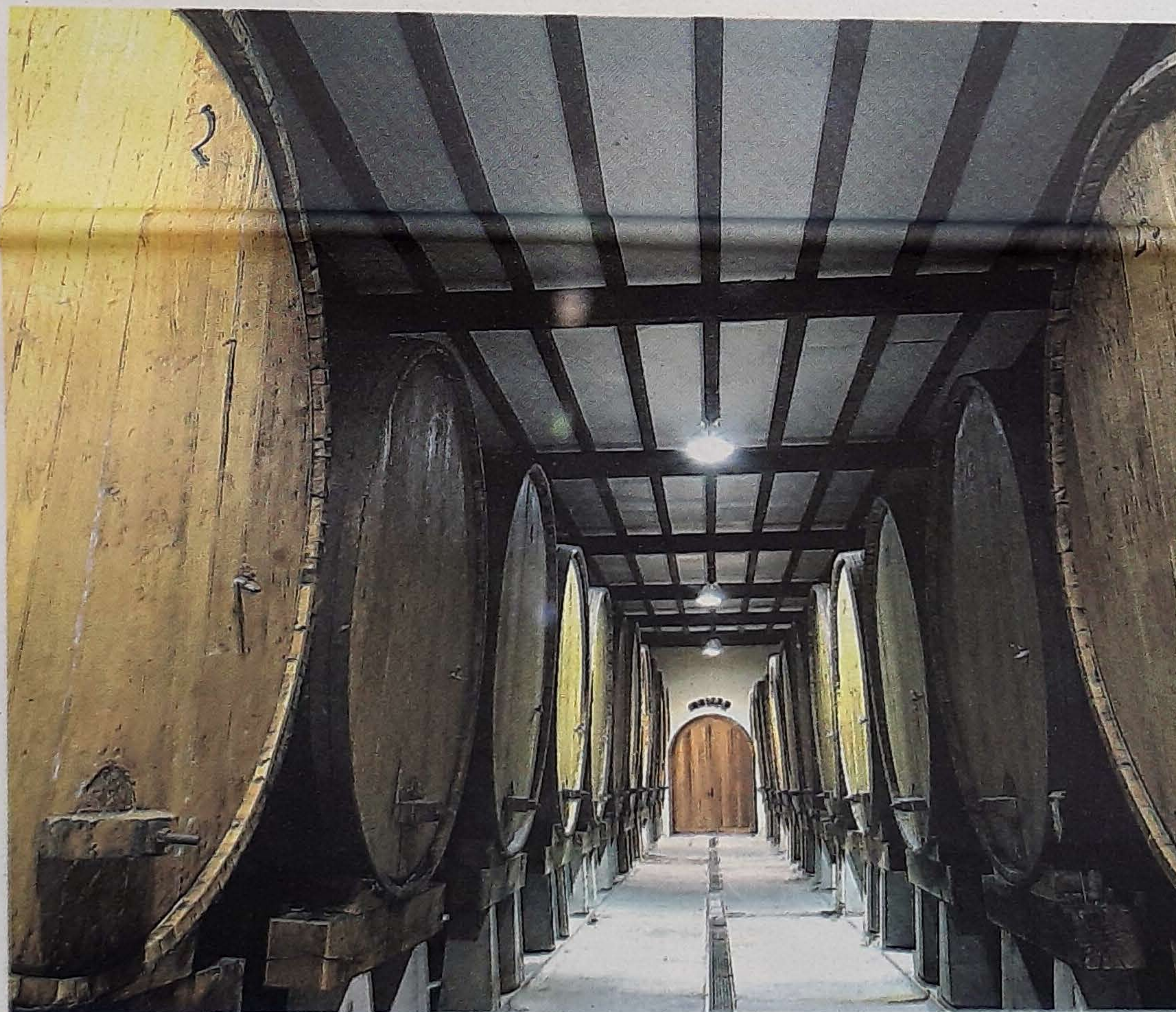
GARBITU Sagarrak garbitu egiten dituzte, eta lortutako zukua upeletan gorde.

ten dute; ontziaren barruan muztio zakar, gozo eta lodikotea sagardo arin, lehor eta bizi bilakatuko da, bi irakinaldiren ondoren.