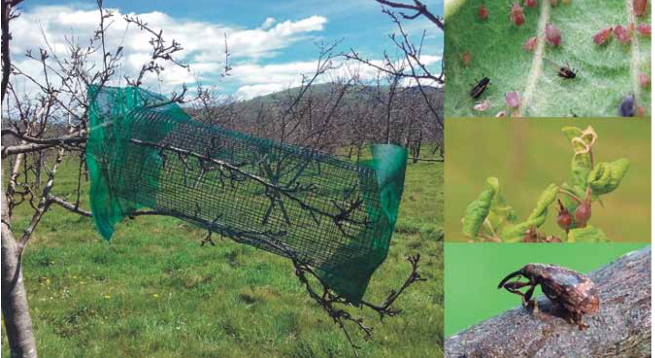
Asturiarrek egindako esperimentuak erakutsi du hegazti intsektujaleek nabarmen murrizten dutela sagarrondoak kaltetzen duen animalia kopurua. Oviedoko Unibertsitatea eta Serida