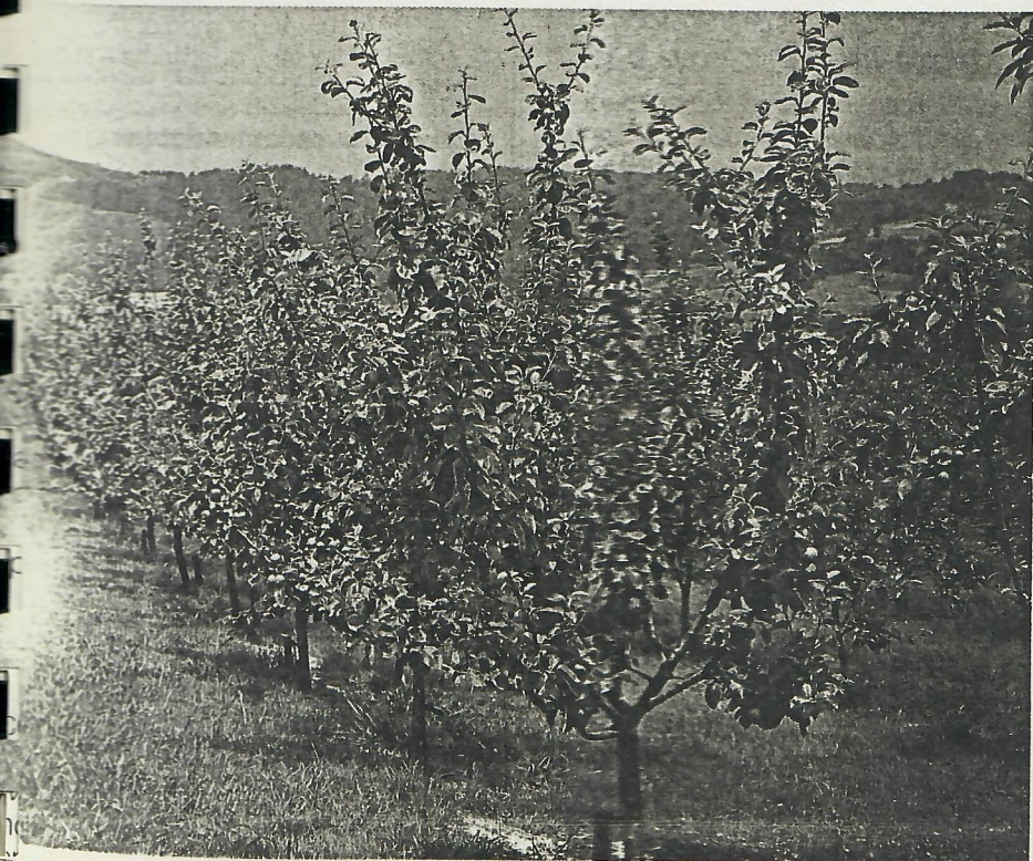
Plantación experimental de manzana de cuatro años de edad, en Zubieta.

dutelako. Esaten dutenez klimatologia eta gaur egun arbolek jasaten dituzten arreta hobeak zerikusia badute.