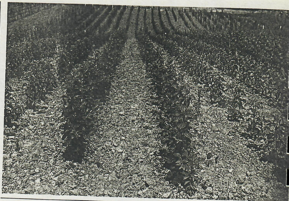
Vivero de variedades de manzana de sidra en la Finca Zubieta, de Hondarribia, dependiente de la Diputación Foral de Guipúzcoa.

Zazpi milioi litro ekoizteko 150.000 eta 200.000 arteko arbolak behar direla esan genezake. Kontu-