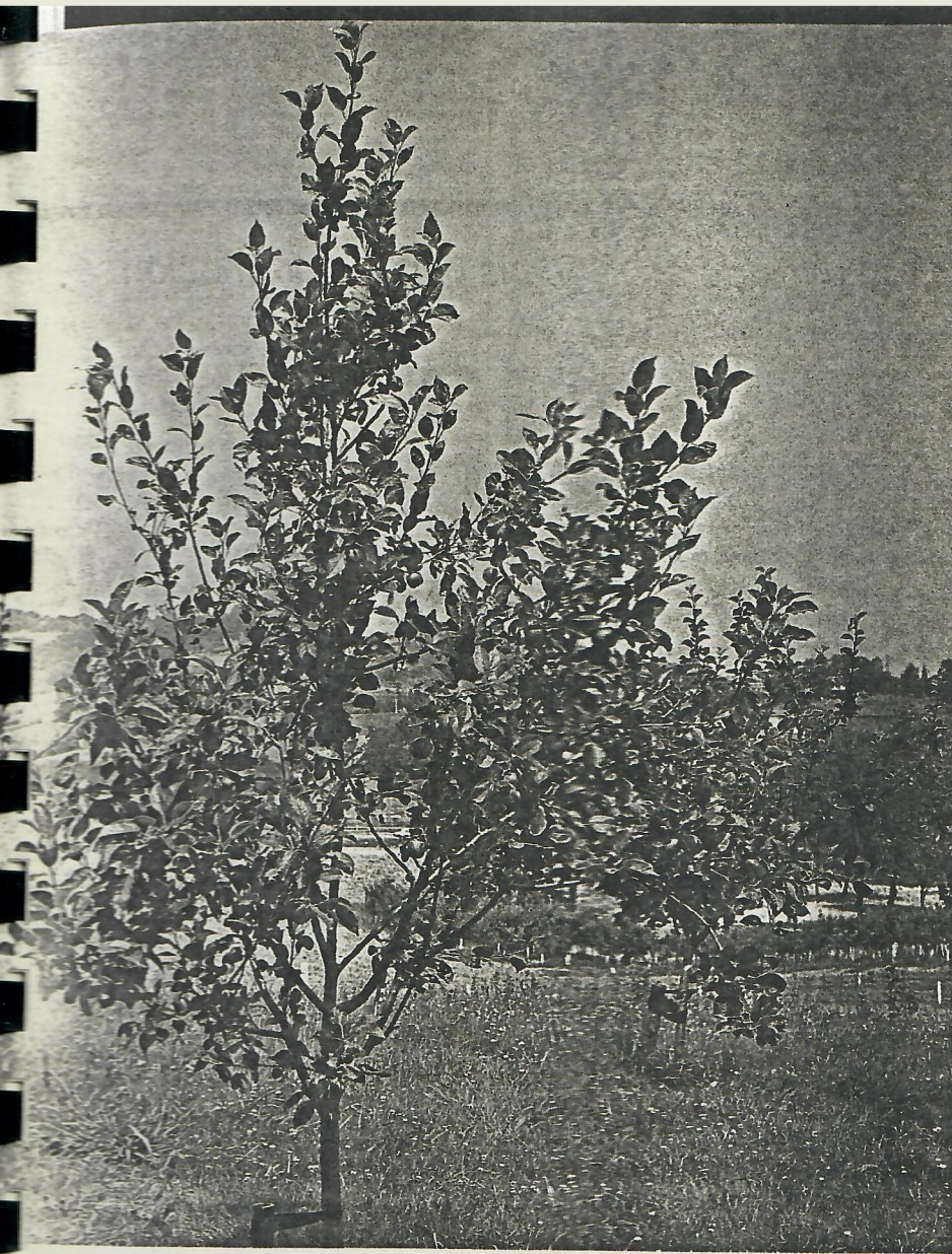
Manzano de sidra en eje central en la estación experimental de la Diputación guipuz- ma.