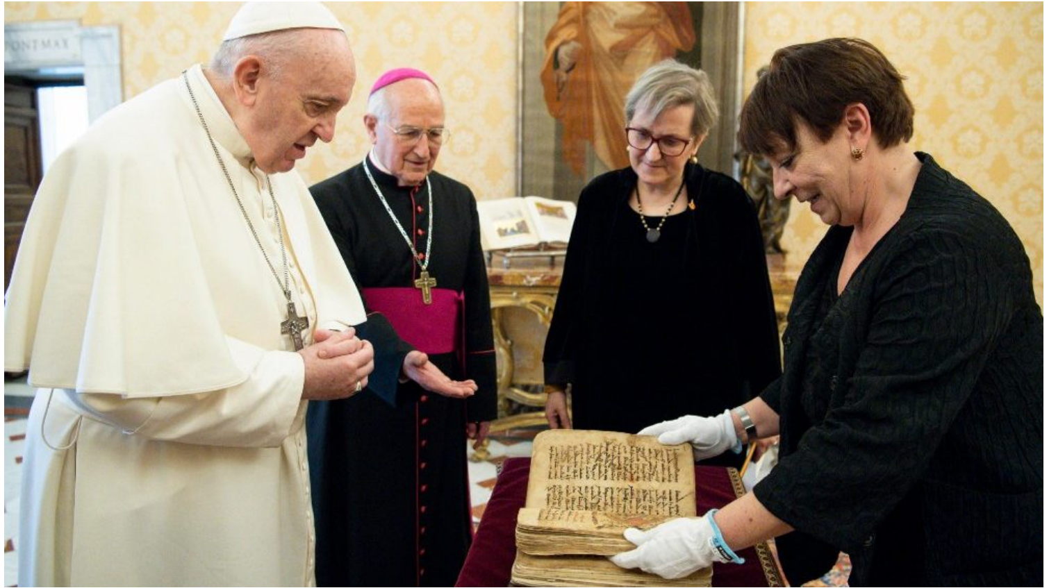
Libro Sagrado de Qaraqosh presentado al Papa Francisco.