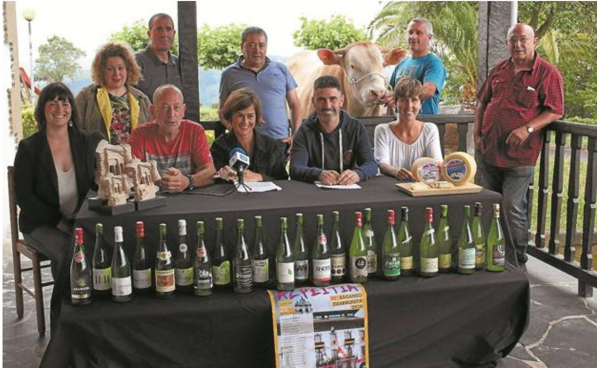
Organizadores y representantes municipales durante la presentación del Día de Santiago, en la sidrería Añota.