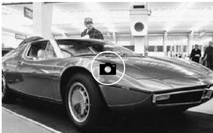
📷 Fotogalería: El Maserati Bora cumple 50 años