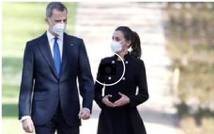
📷 Madrid rinde su homenaje a las víctimas del terrorismo