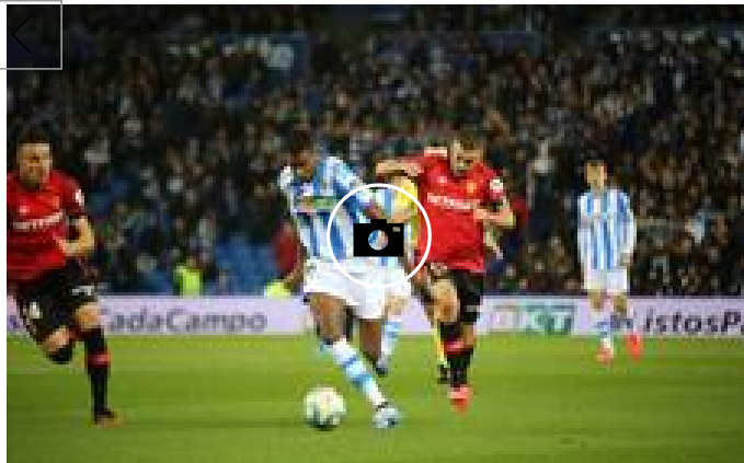
Real Sociedad-Mallorca, en imágenes