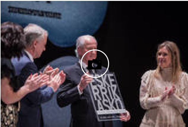
Los premios Sabino Arana, en imágenes