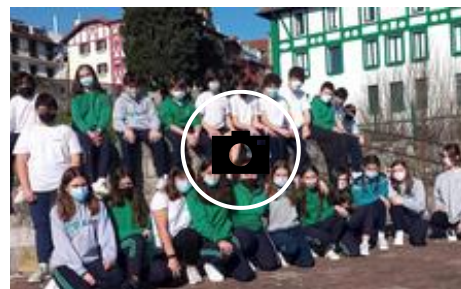
📷 Los alumnos de Egiluze Ikastetxea de Hondarribia