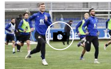
📷 La Real entrena en Zubieta pensando en el Granada