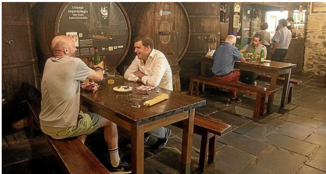
Comensales, ayer, en la sidrería Lizeaga, que volvió a abrir sus puertas tras el confinamiento.

se amoldan a la situación prescindiendo de las mesas corridas, limitando el uso de 'kupelas' y con la sidra en botella