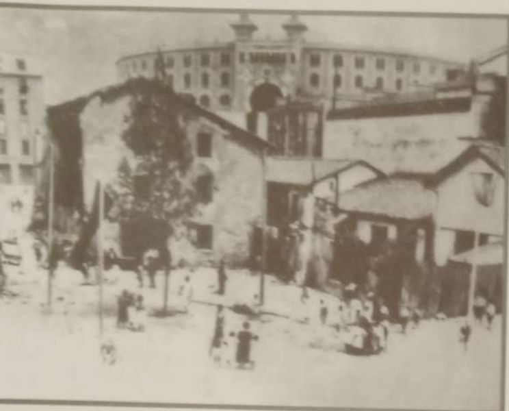
Sidrería Sagarna, en la calle Secundino Esnaola, del barrio de Gros.