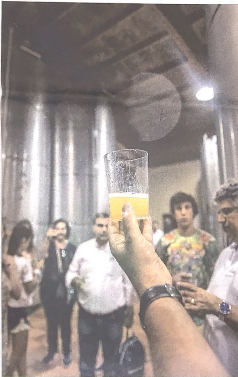
El creciente número de visitantes confirma el atractivo del mundo de la sidra.

LA TEMPORADA LLEGA CARGADA DE BUENAS NOTICIAS Y DE PROYECTOS. LOS DATOS DE LA COSECHA 2015 EN EUSKADI HAN SIDO MUY BUENOS, CON LA ELABORACIÓN DE ALREDEDOR DE 13 MILLONES DE LITROS DE SIDRA. PERO ADEMÁS, SIGUE CRECIENDO EL POTENCIAL DE LA CULTURA DE LA SIDRA COMO GENERADORA DE RIQUEZA Y COMO ATRACTIVO PARA LA CAPTACIÓN DE VISITANTES A NUESTRO TERRITORIO.