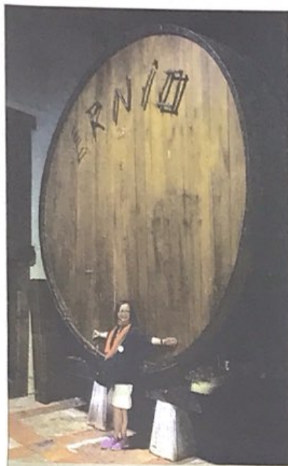
Cada vez más sidrerías ofrecen visitas guiadas para que los turistas puedan conocer y experimentar la cultura de la sidra.