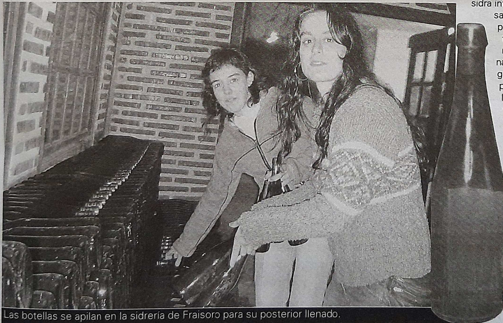
Las botellas se apilan en la sidrería de Fraisoro para su posterior llenado.

Además del curso de cata, el Centro Agrario de Fraisoro organiza otras iniciativas relacionadas con la sidra como la poda y plantación de frutales, con la influencia de la materia prima y el procesamiento en la calidad de la sidra y otro curso centrado en la manzana para la sidra.