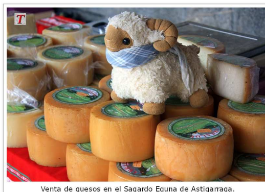
Venta de quesos en el Sagardo Eguna de Astigarraga.

En la Plaza de los Fueros se dan cita una veintena de sidreros de la comarca que ofrecen sidra a quienes se acerquen a sus respectivos puestos, vaso en mano, a solicitarla. Lo único que debes hacer para poder participar es comprar el vaso. Tampoco faltan los puestos en los que poder adquirir pintxos o bocadillos para acompañar al preciado jugo de la manzana.