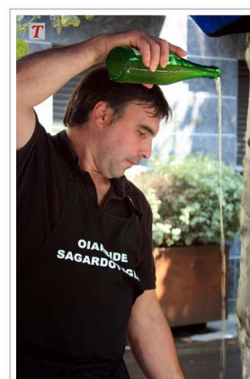
Sirviendo sidra en el Sagardo Eguna.

El día veintiséis de julio, día de Santa Ana , la localidad Guipuzcoana de Astigarraga celebra el Sagardo Eguna , día de la sidra. Esta fiesta se celebra desde 1976 y es considerada como el Sagardo Eguna con más solera de todo el País Vasco . Pese a que la localidad de Astigarraga se encuentra a menos de diez kilómetros de la ciudad de Donosti-San Sebastián y, por lo tanto, posee un modo de vida muy urbano, estamos ante una fiesta de marcado carácter rural. Degustación de productos artesanos como quesos o la propia sidra y exhibición de deportes rurales son, en cierto modo, las señas de identidad de esta jornada festiva.