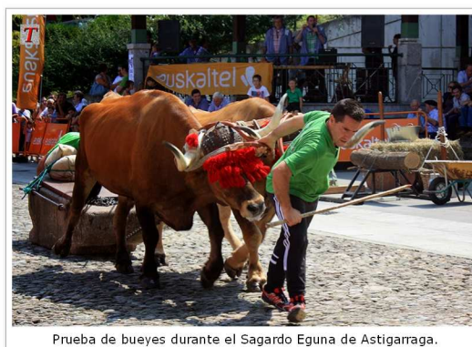
Prueba de bueyes durante el Sagardo Eguna de Astigarraga.

En la Plaza de los Fueros se dan cita una veintena de sidreros de la comarca que ofrecen sidra a quienes se acerquen a sus respectivos puestos, vaso en mano, a solicitarla. Lo único que debes hacer para poder participar es comprar el vaso. Tampoco faltan los puestos en los que poder adquirir pintxos o bocadillos para acompañar al preciado jugo de la manzana.