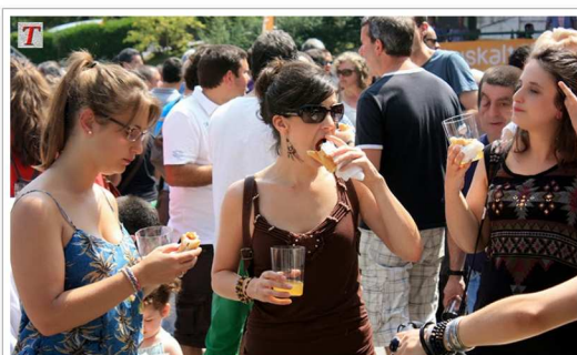
La sidra, ingrediente fundamental del Sagardo Eguna de Astigarraga.

Toda la Plaza de los Fueros de Astigarraga es un hervidero de gente que va de puesto en puesto degustando la sidra Pero también son muchos los que se arremolinan en torno al recinto que se ha vallado para la exhibición de deportes rurales. Entre ellos destaca el arrastre de pesadas piedras -según hemos podido saber de 1700 kilos- por parejas de bueyes. Quienes con más interés siguen este espectáculo son aquellos que participan en las diferentes apuestas que giran en torno a la exhibición.