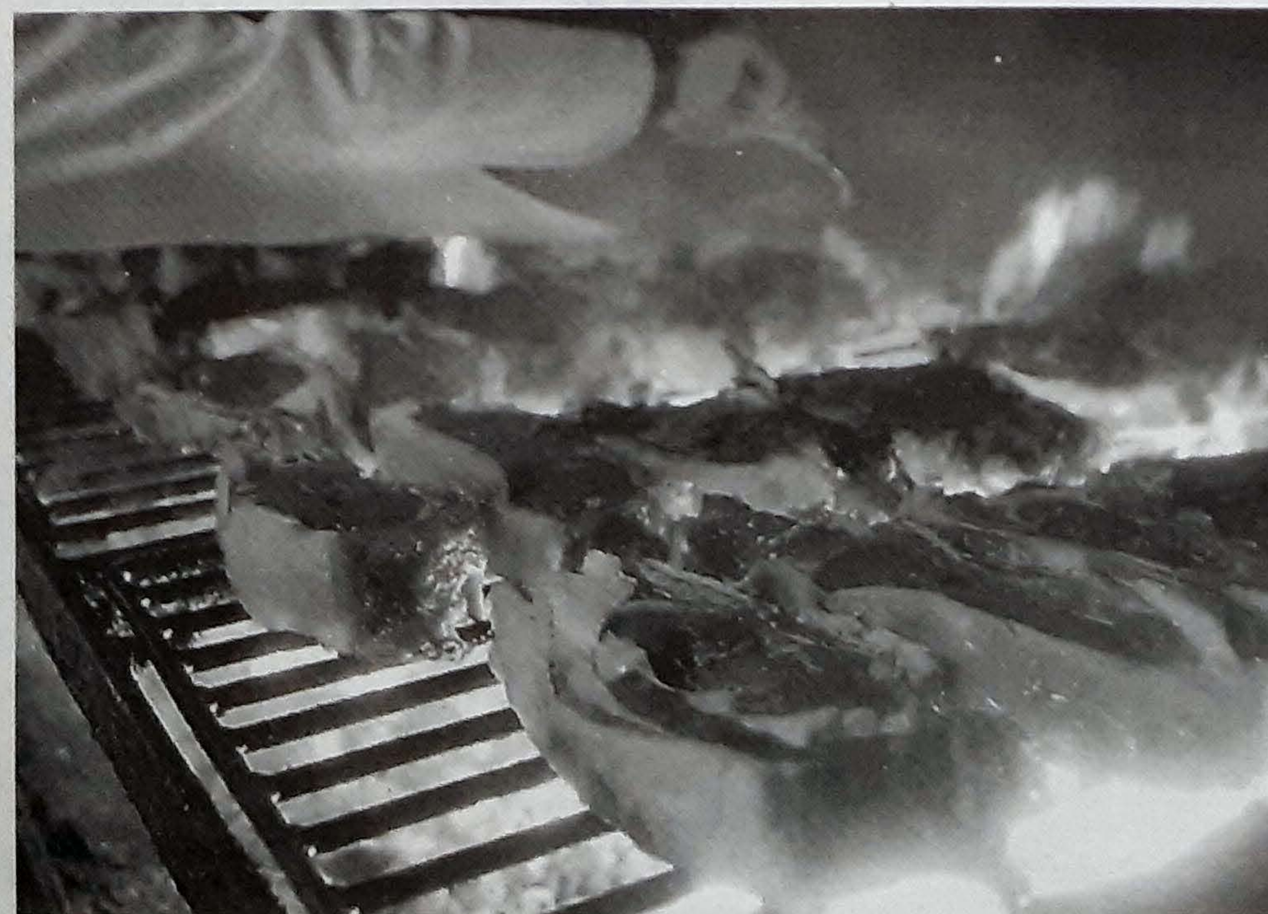
La jugosa chuleta de vaca, complemento ideal a la refrescante sidra. R. Plaza

de Astigarraga, las asociaciones culturales del pueblo y los sagardogiles de Astigarragaldea, y que, como dijo su secretario, Joxe Angel Goñi, está abierto a toda Euskal Herria, y a todos «los amantes» de la sagardoa.