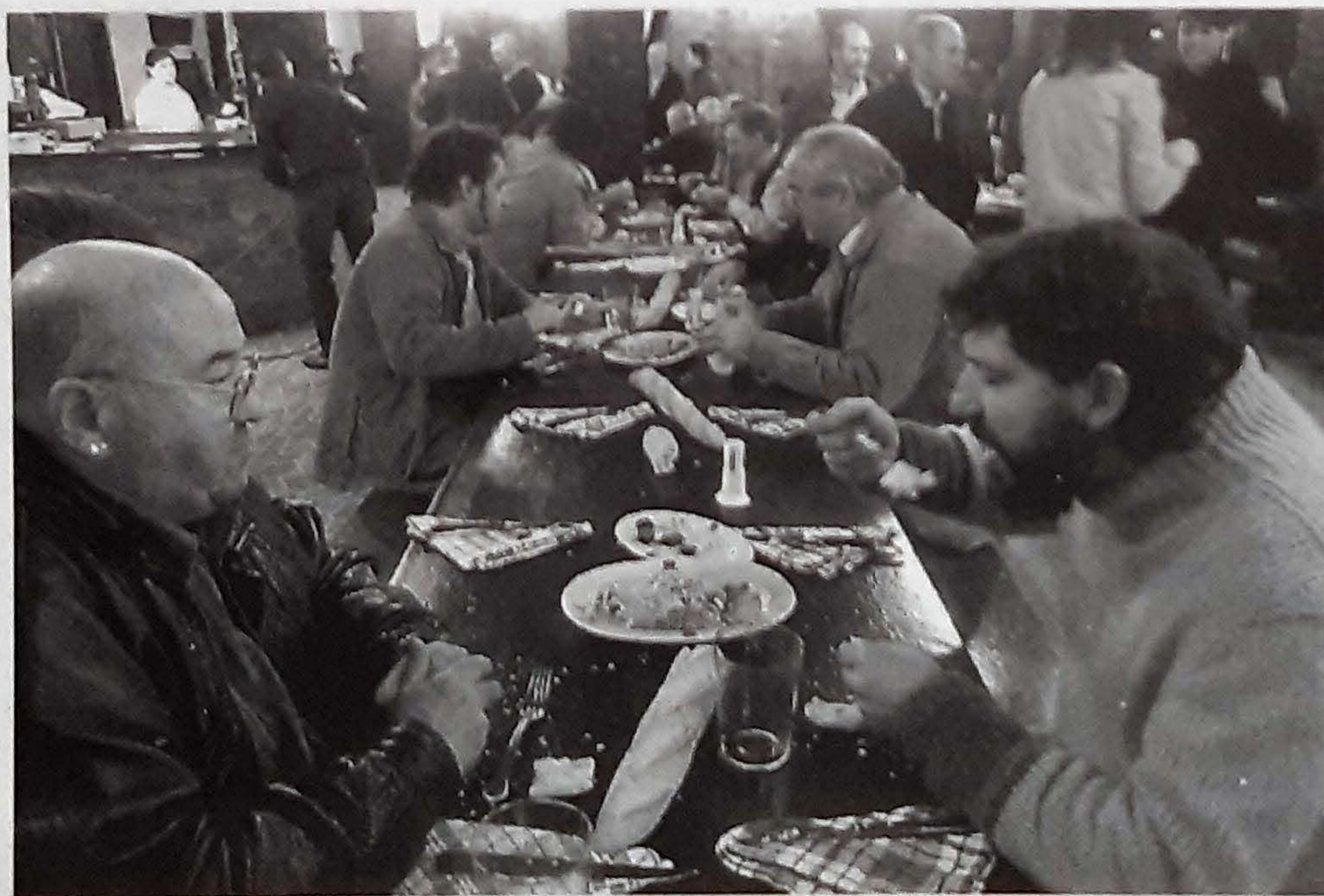
200 invitados se sentaron a comer y beber en las alargadas mesas de Petritegi.

El tan esperado Sagardo Berriaren Eguna significa para los aficionados a la sagardoa (y no sidra), poder disfrutar de esta nueva cosecha, bien al txotx en todas las sagardotegis de Euskal Herria, bien de botella en los establecimientos hosteleros o en su casa. Por Segunda vez, los actos estaban organizados por el Consorcio Sagardun, iniciativa colectiva que reúne al Ayuntamiento