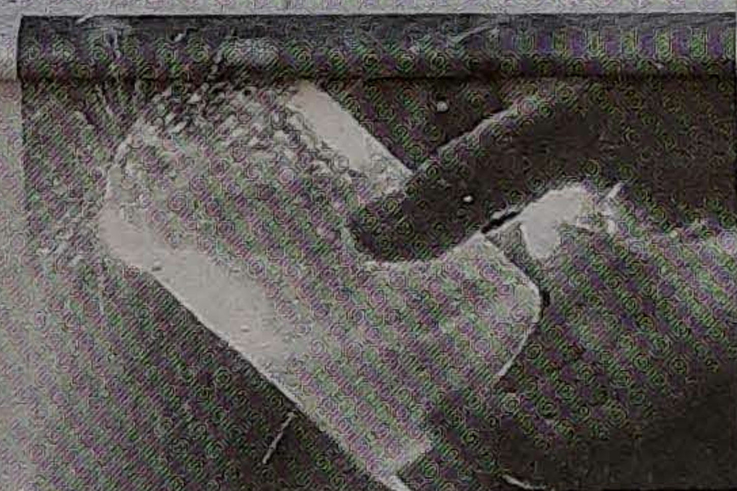
El brillo de la sidra en el vaso.

3 Materia prima. Las bebidas están ciertamente vinculadas a la materia prima del Malus Communis, pero también al arte del "sagardogile" que ha de resolver cada año una ecuación distinta, esto es la combinación de 15 tipos distintos de manzana autóctona con la norma y gallega.