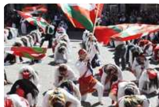
Dantzari Festa 2014 ...