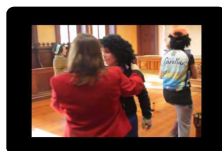
Iritsi da O gripea (III)