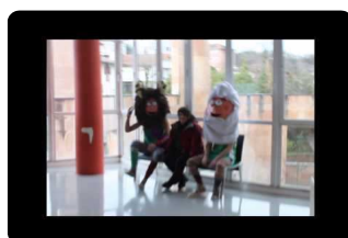
Iritsi da O gripea (I)