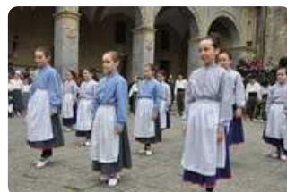
Dantzari txiki eguna