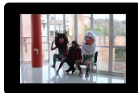
Iritsi da O gripea (I)