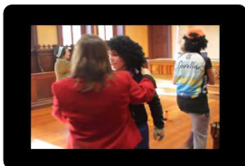
Iritsi da O gripea (III)