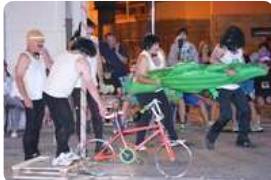
Ergobiako festak (igandea ...