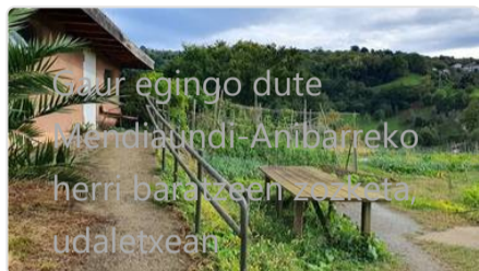
Gaur egingo dute Mendiaundi-Anibarreko herri baratzeen zuzketa, udaletxean