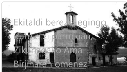
Ekitaldi berezalegingo dute etzi parrokian, Zikuñagako Ama Birjinaren omenez