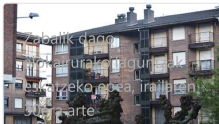
Zabalik dago proiekturako laguntzak eskatzeko ohea, irailaren 30era arte