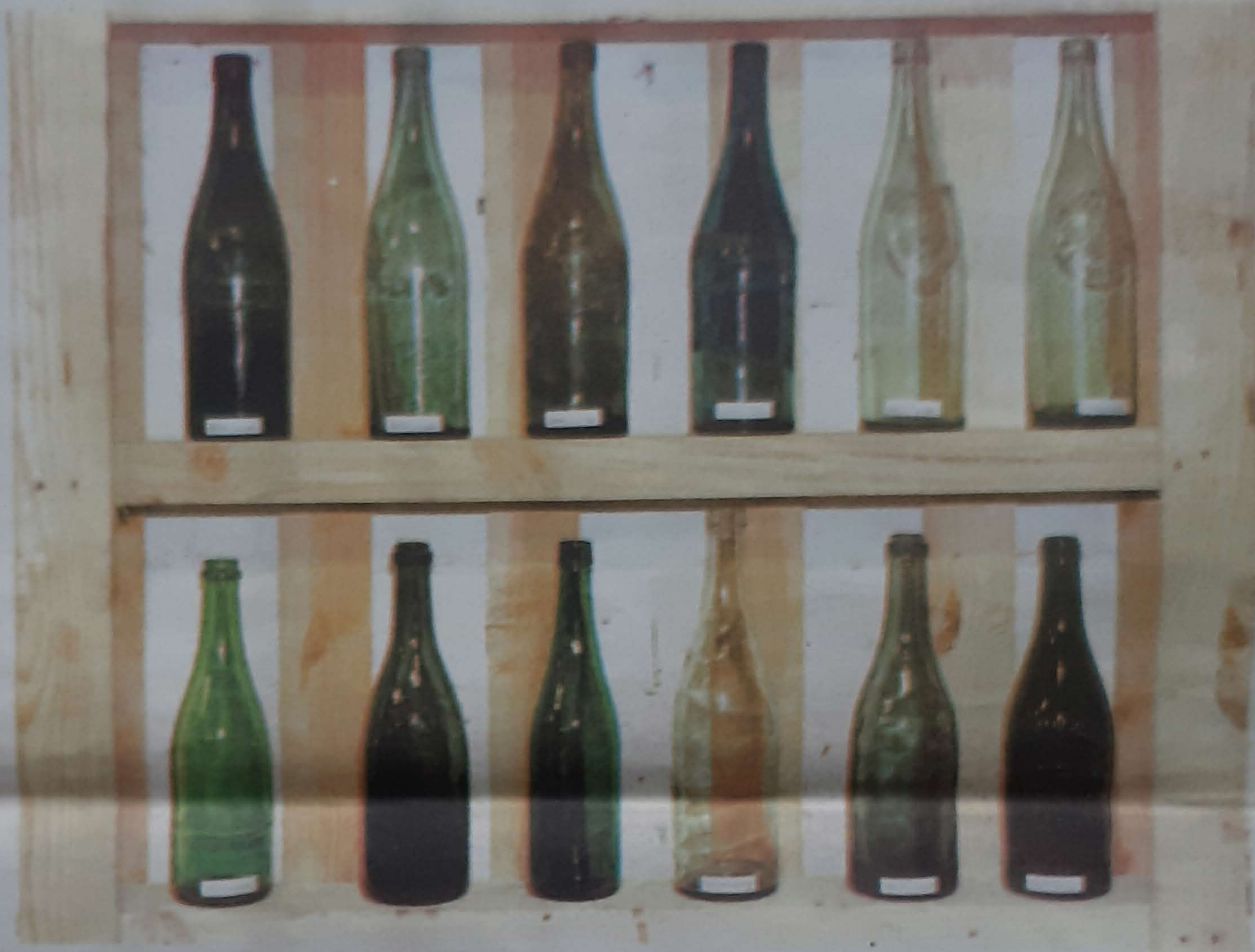
Historian sagardoa botilaratzeko erabili diren botila ezberdinak.

Sagardogile gehienek, ohiturari jarraituz, ilbeheran egiten dituzte sagardoari lotutako lan guztiak. Zientifikoki frogatuta ez badago ere, praktikak erakutsi du hobe dela hala egitea. Botilaratzeko, ba-