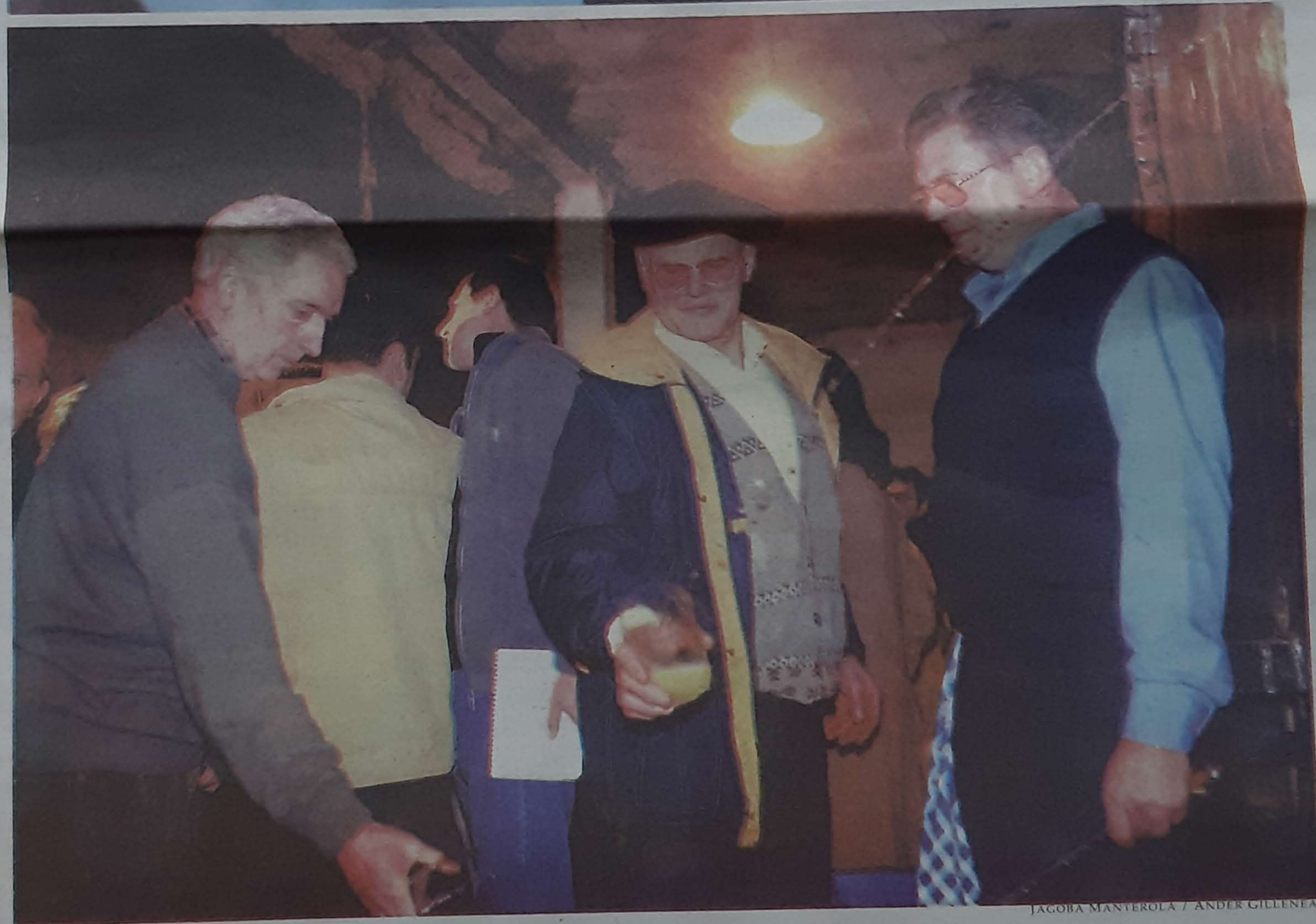
••• Txotx denboraldia bukatu da. Iritsi da sagardoa botilatik edateko garai.