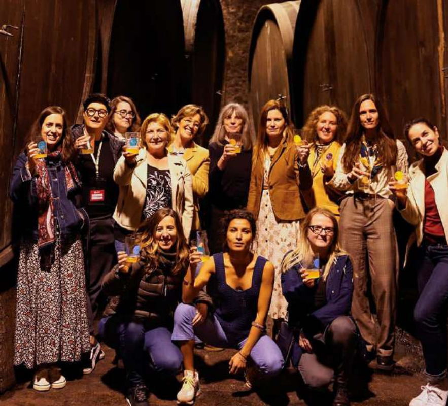
Argazkia · International Cider Summit Asturias (Gijon, Asturias)

rriak), Sabaiza premium sagardoak brontzea (sagardo naturala), Naizhaga premium sagardoak brontzea (sagardo naturala) eta Orbaibar premium sagardoak brontzea (sagardo naturala).