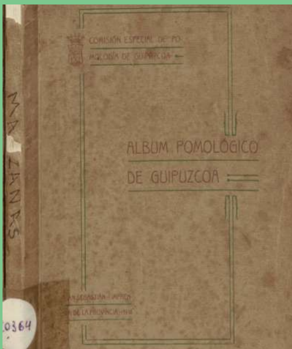
“Álbum Pomológico de Guipúzcoa” (Vicente Laffitte).

Algunos de los planteamientos de estos ingenieros agrónomos fueron recogidos en la política agraria de la Diputación de Gipuzkoa. Concretamente, en la década de 1910 puso en marcha un ambicioso plan para la renovación del sector que consistió en la creación de la estación pomológica y la sidrería experimental de Fraisoro (1910-1911), la apertura de la escuela sidrería de Fraisoro (1912), la creación de la Comisión Pomológica (1917) y la publicación de libros y cuadernillos para formar e instruir a los baserritarras.