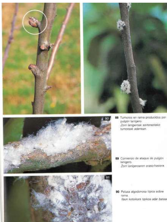
Información sobre el pulgón lanigero que afecta a los manzanos (Plagas y enfermedades de los manzanos de Guipuzcoa).