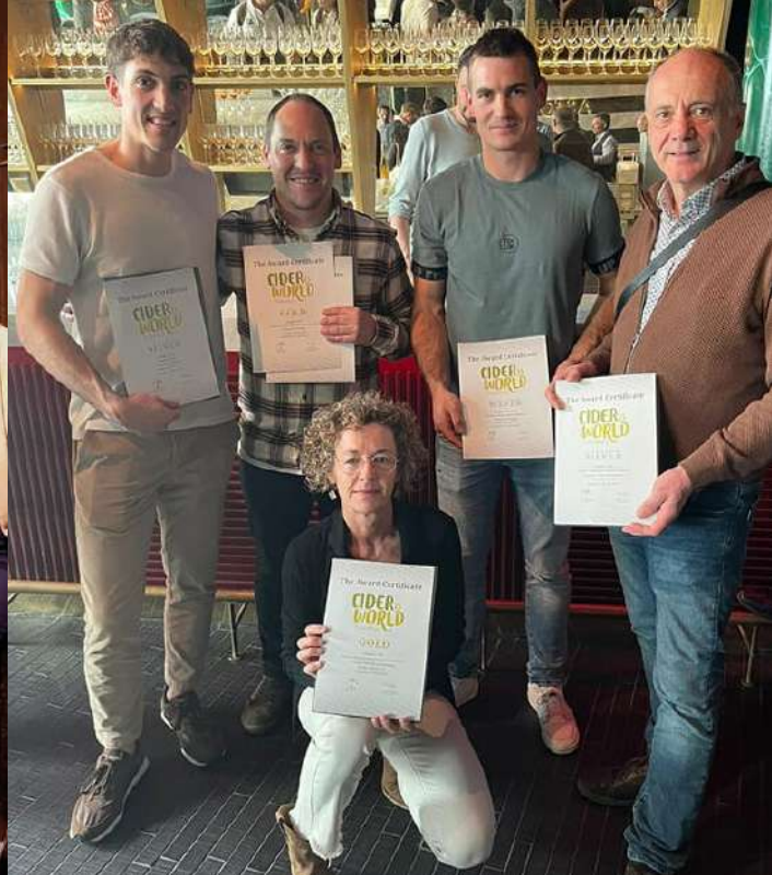
Argazkia · Cider World'23 (Frankfurt, Alemania)

Martxoaren 20tik 26ra International Cider Summit