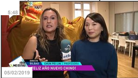
El Instituto Chino de Bilbao celebra el año del cerdo:...